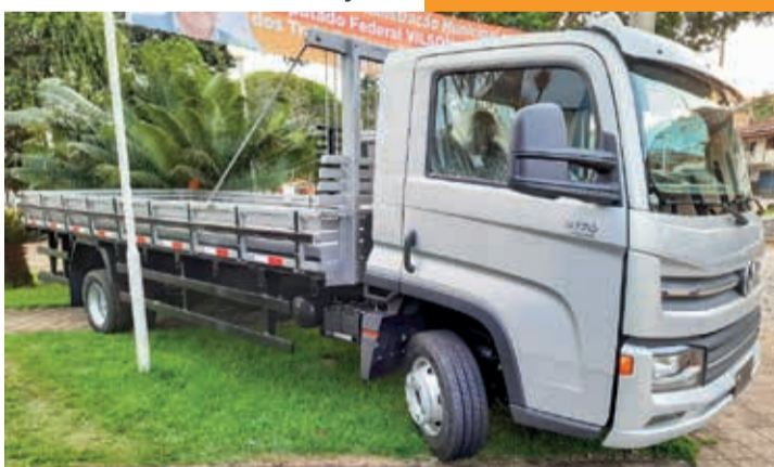
Caminhões para atender a agricultura familiar