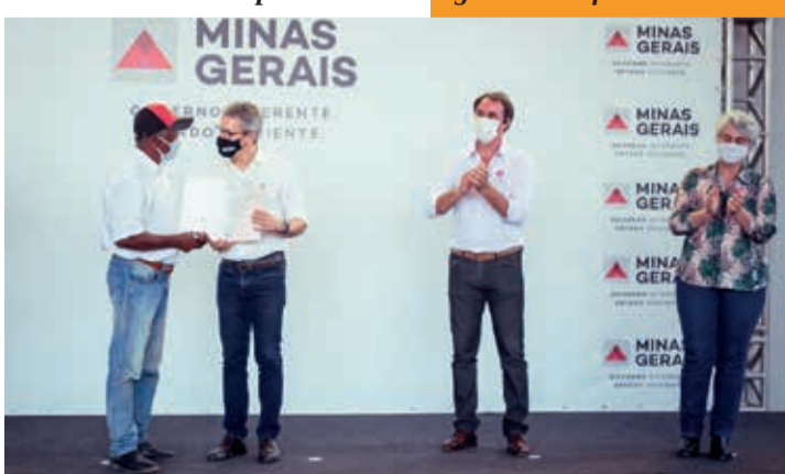
Entrega de Títulos de terras Devolutas