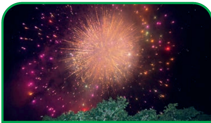
Show Pirotécnico iluminou o céu de Ladainha na noite de Réveillon