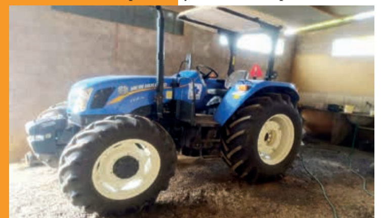
Aquisição de um trator agrícola