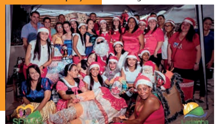
Primeiro Natal Social Kids em Ladainha