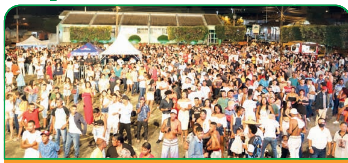
População curtiu dois dias de festa para receber o ano novo

Após quase dois anos de pandemia, Réled frisa que as pessoas já estavam sentindo a necessidade do retorno dessas festividades, e já assegura que, se Deus quiser, em maio será realizada a Festa de Concorórdia do Mucuri, e em Julho a Festa do Ladainhense Au-