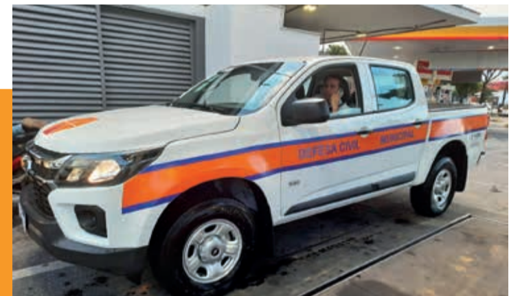
Veículo para a Defesa Civil Municipal