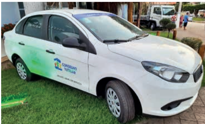
Veículo a serviço do Conselho Tutelar

situações que vão se apresentando no decorrer da nossa caminhada”. Ele cita as chuvas que caíram no final de ano, é uma chuva abençoada, que irrigou, que molhou as plantações, mas também trouxe transtornos nas estradas, pontes e manilhamentos. Assegura que, assim que o tempo firmar já terá uma equipe grande preparada para num prazo mais curto possível conseguir executar todo trabalho necessário.