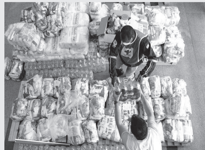
A primeira parte dos donativos arrecadados já foi repassada à Cruz Vermelha, para distribuição em Nova Lima