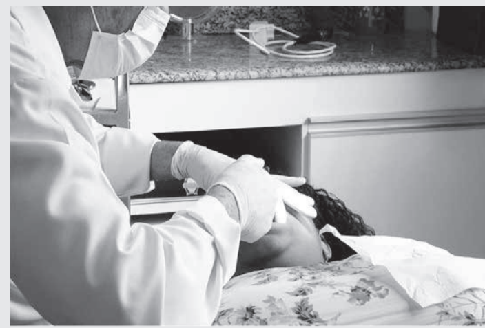
Profissionais respondem pela qualidade dos serviços odontológicos prestados

Segundo o autor, a prótese dentária foi implantada de forma precária. Após 15 dias de uso, ele notou que a prótese