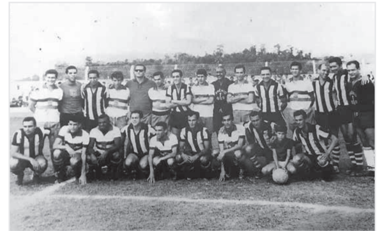
Seleção de 1950