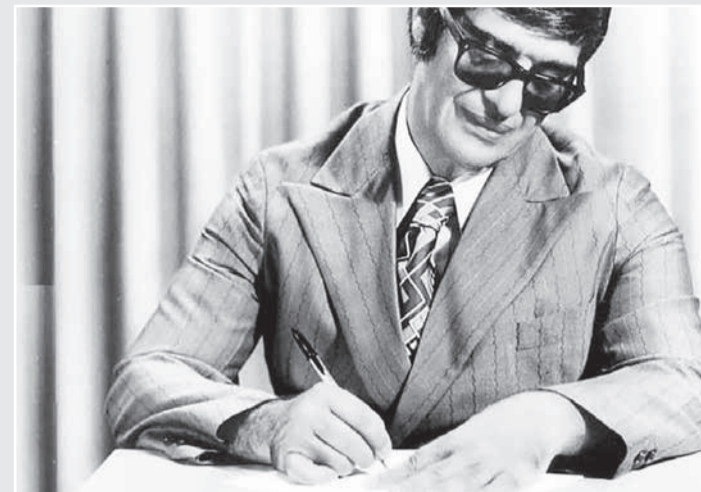
Médium nascido em Pedro Leopoldo faleceu em 2002 e é uma das figuras mais relevantes do espiritismo no Brasil

A ação foi ajuizada por um dentista, filho adotivo do médium, que afirmou que o livro, lançado em maio de 2018, traz cartas e fotografias de Chico Xavier, atribuindo-lhe a coautoria da obra, ao lado do destinatário da correspondência, apesar de o religioso ter falecido 16 anos antes. O autor alega que o nome de Francisco Cândido Xavier foi utilizado como “chamariz de venda”, pois os escritos do