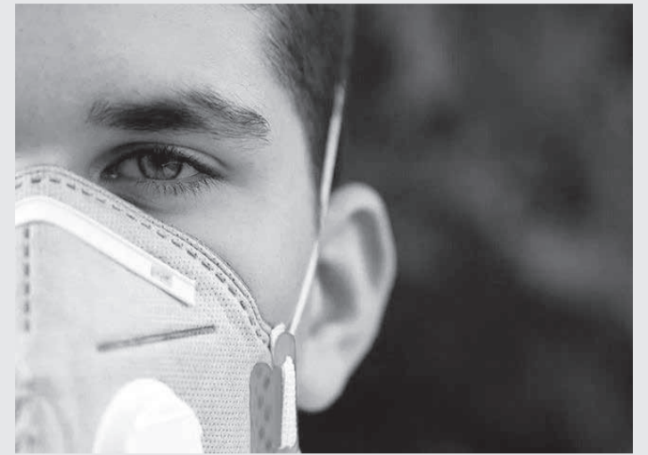
Medida vale para casos leves e moderados da doença desde que não apresente sintomas respiratórios e febre

Para aqueles que no sétimo dia ainda apresentarem sintomas, é obrigatória a testagem. Caso o resultado seja negativo, a pessoa de-