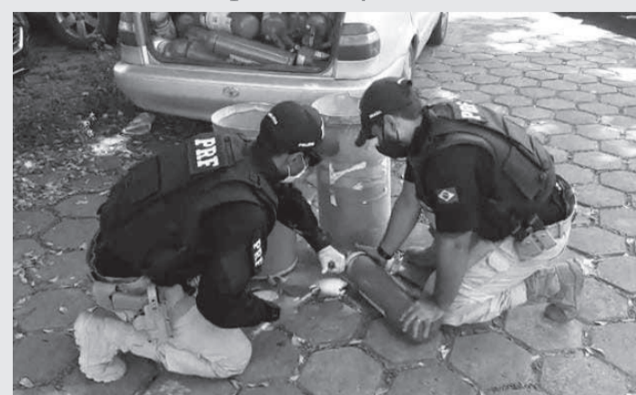
PRF prendeu pai e filho transportando cocaína dentro de extintores de incêndio, na BR 116, em Teófilo Otoni

Em vistoria ao compartimento de carga do automóvel foram verificados vários extintores de incêndio, que segundo informação dos ocupantes seriam comercializados durante o trajeto para custeio da viagem. Na vistoria aos