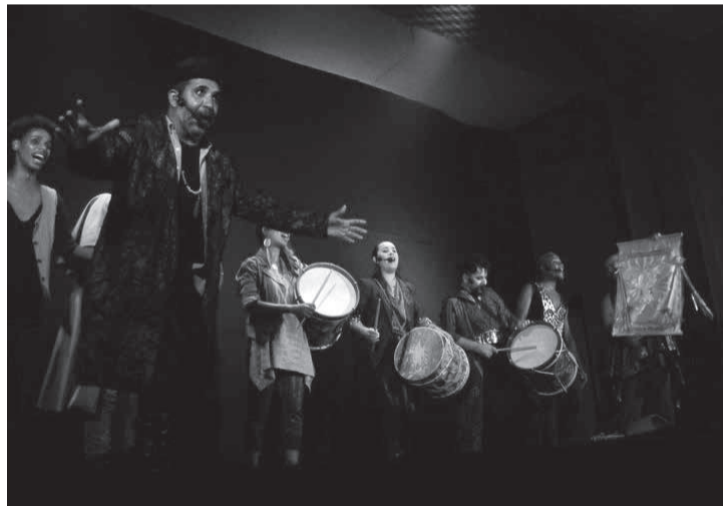
Sarau In-Cena, 15 anos de estrada

In-Cena, além fronteiras, é a produção do Festival do Patrimônio Cultural de Paracatu, realizado pela ADESP através da Lei de Incentivo à Cultura (Lei Rouanet) no segundo semestre, iniciando a produção em breve.