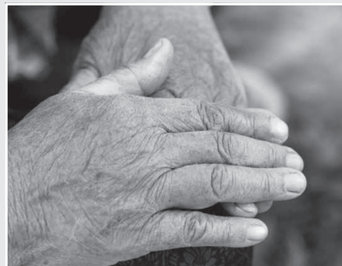
Proteção de idosos e pessoas com deficiência é garantido pela legislação brasileira (Foto ilustrativa)

O Ministério Público Minas Gerais (MPMG) ajuizou ação para aplicação de medidas protetivas em benefício dos três porque o pai, em idade bastante avançada, apresenta quadro compatível com demência decorrente de Mal de Parkinson, e os filhos, embora não sejam idosos, têm limita-