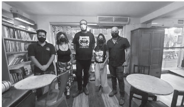
Projetos em parceria com a Livraria Papo Café