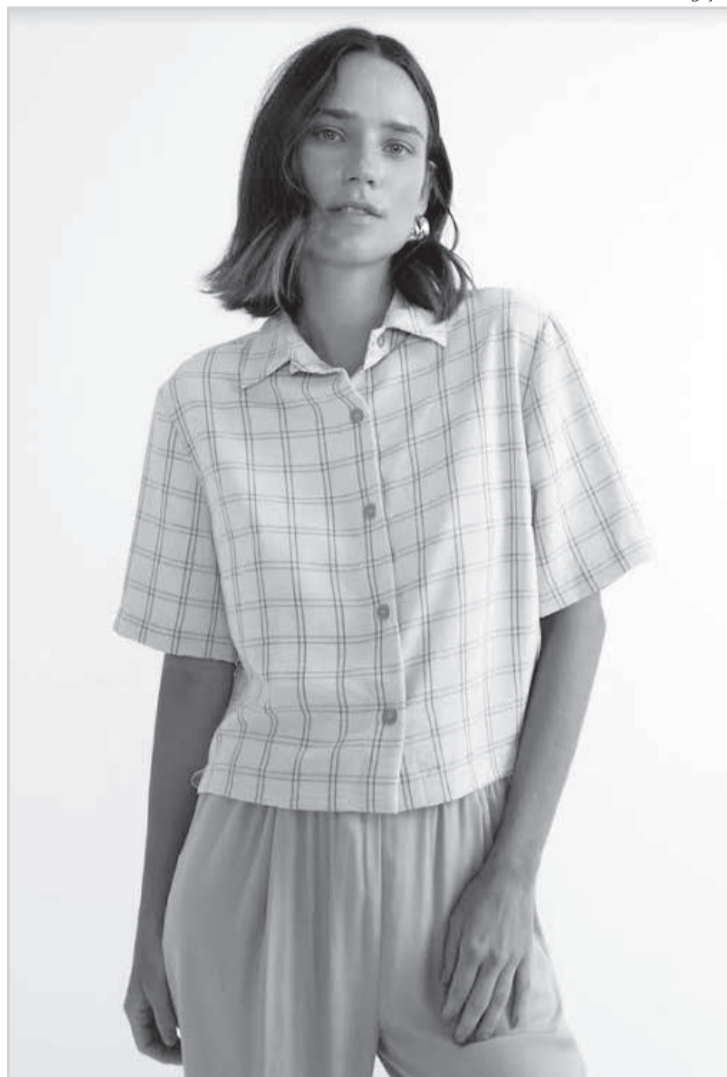
Renner: pegada sustentável

• A notícia fashion mais interessante dos últi-