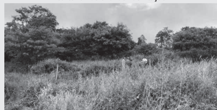
Segunda vítima encontrada pelo Corpo de Bombeiros, na manhã do dia seguinte

Ele foi submetido ao teste de etilômetro com