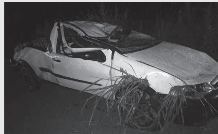
O condutor estava embriagado e não tinha carteira nacional de habilitação

Na noite de domingo (23/01), a Polícia Militar Rodoviária foi acionada para registro de um acidente na rodovia estadual MG-405, KM 56, município de Jacinto. No local, já estava uma equipe da Polícia Militar da cidade, que prestou o primeiro atendimento e isolou o local onde estava o veículo, e alguns metros à frente a vítima fatal, o passageiro.