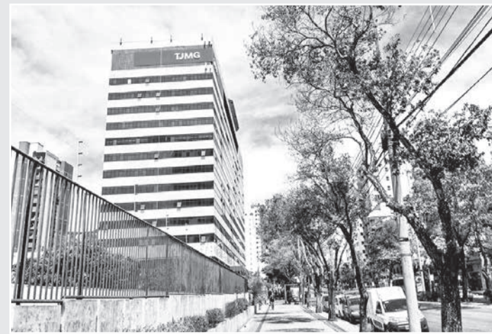
Tribunal de Justiça de Minas reconhece direito de professor

Mas, apesar da aprovação da solicitação pelo departamento, foram-lhe atribuídas sucessivas faltas nos meses de agosto, setembro, outubro e novembro de 2019. Temendo o comprometimento de sua avaliação especial de desempenho durante o estágio probatório, ele assumiu, com a permissão do DDPS, aulas de reposição, assinando fo-