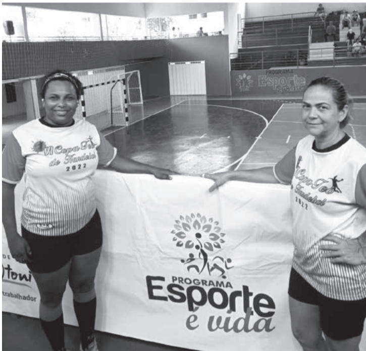
Simildes com a auxiliar