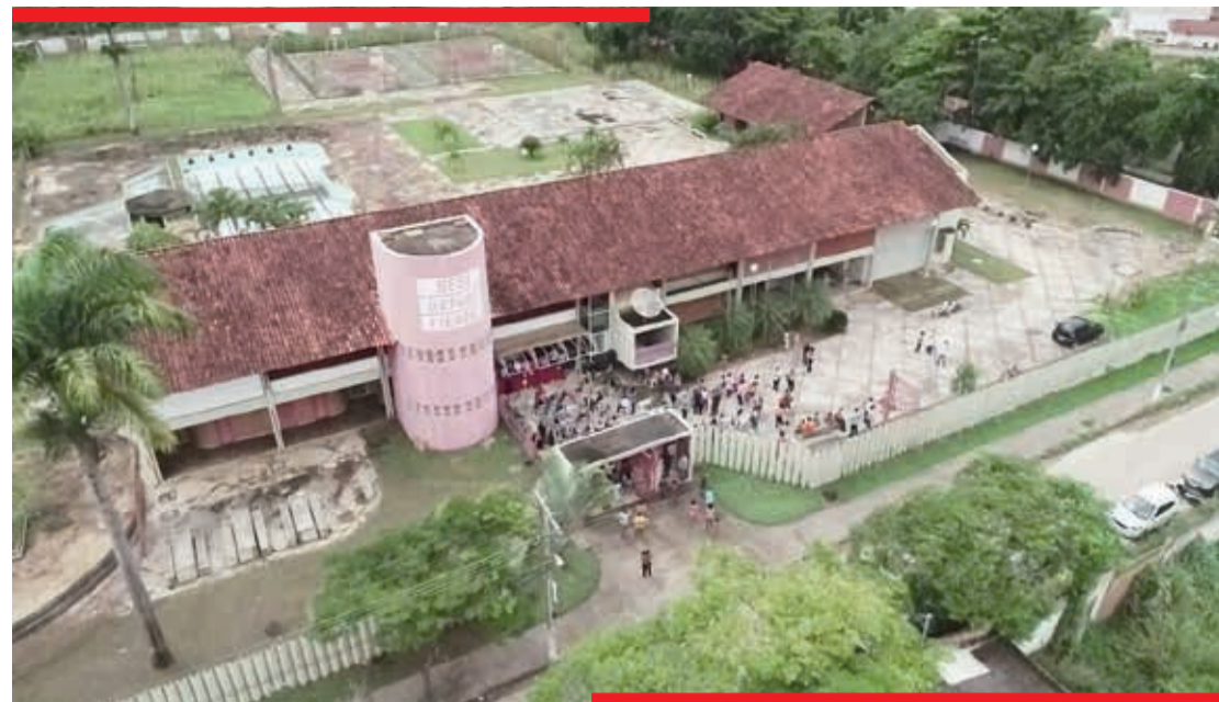
O prédio foi adquirido para instalação de um Centro de Educação Infantil