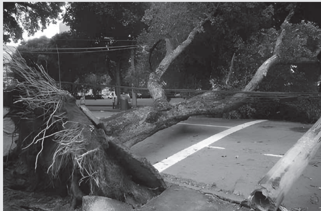
As pessoas nunca devem se aproximar de árvores caídas em meio a fios partidos, pois há risco de choque elétrico, que pode provocar ferimentos graves e até fatalidades

Companhia orienta que não se deve aproximar e nem permitir que outros se aproximem de fios rompidos