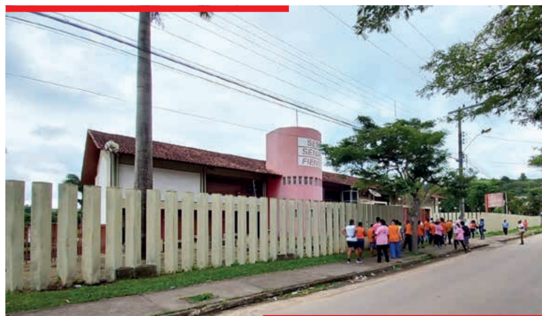
O prédio está localizado no Bairro São Jacinto, ao lado da Doctum