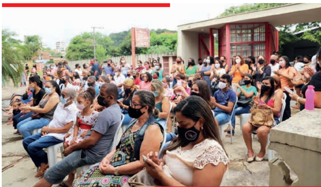
Participaram da solenidade, a comunidade do Bairro São Jacinto e demais convidados