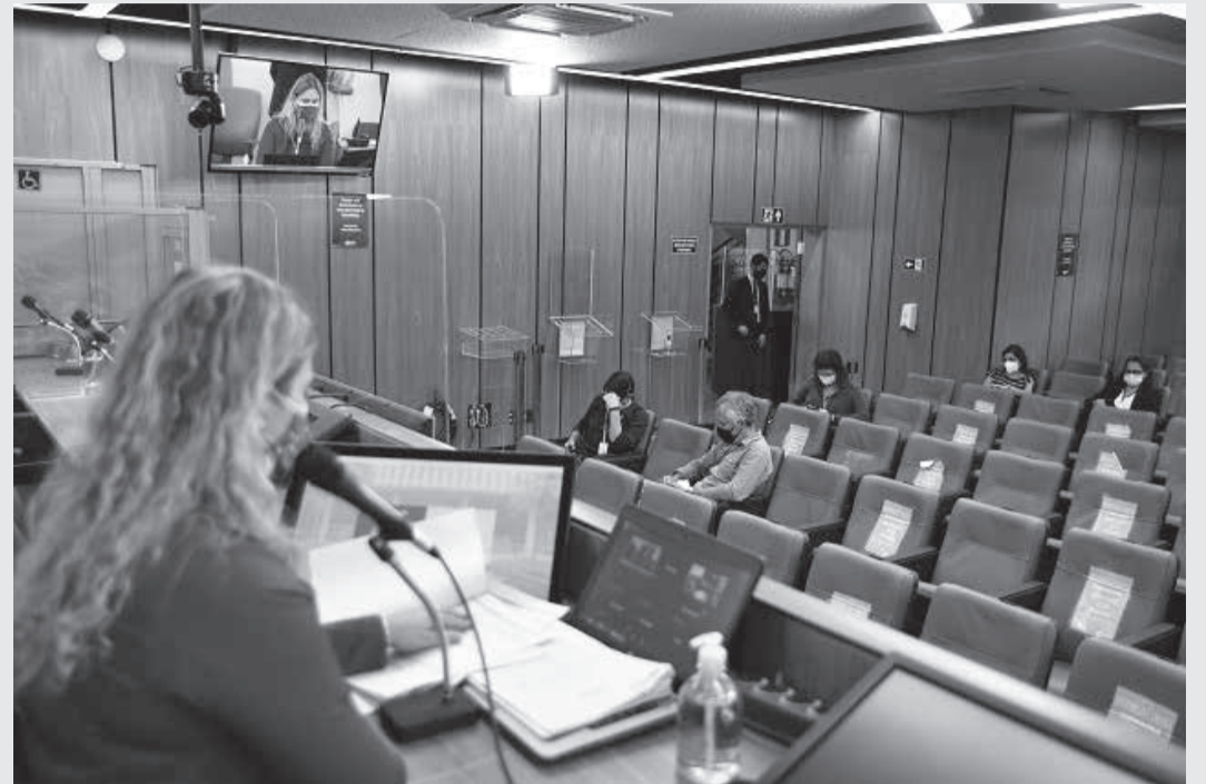
Funcionamento das escolas cívico-militares foi questionado por meio de Ação de Inconstitucionalidade no STF

De acordo com parecer da comissão, matéria do projeto de lei é de competência da União