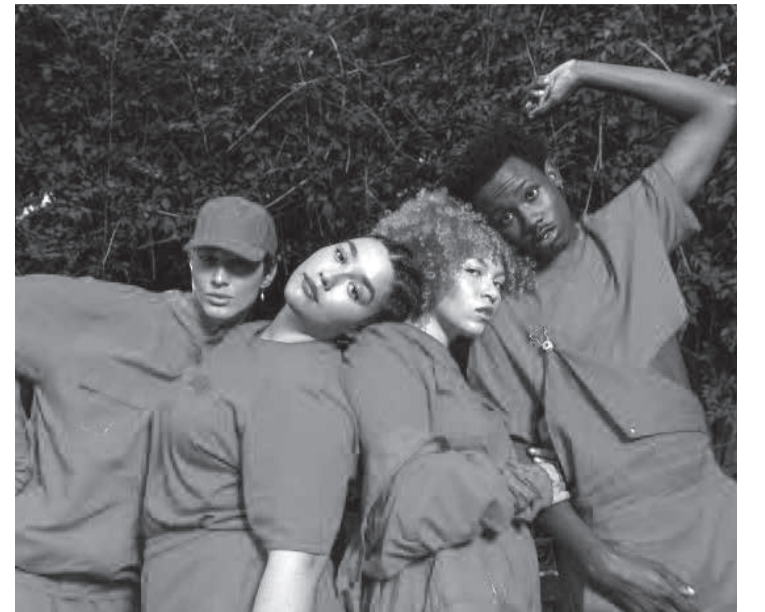
Heinz + Approve: collab fashion

• No Brasil, são muitos os exemplos de collabs de sucesso. As parcerias entre a C&A com estilistas, e da Vivara com a Tommy Hilfiger são bons exemplos. Mas há 'collabs' entre segmentos distintos, como a Heinz e a marca de roupas Approve. Isso sem contar as inúmeras parcerias entre algumas marcas e as chamadas influenciadoras & influenciado-