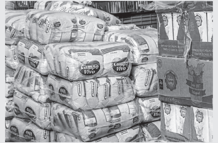
Consumidora foi atingida por fardos de farinha que despencaram de uma altura de 5 metros (Imagem ilustrativa)

O barulho atraiu os funcionários e o gerente da loja, que chegaram ao local e socorreram a cliente. A mulher foi levantada e