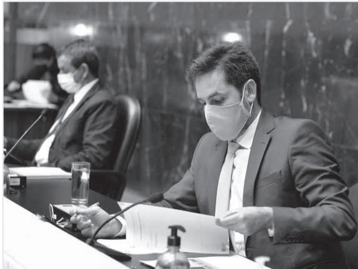
Onze comunicações, entre mensagens e ofícios, foram lidas durante a reunião

Regimento Interno - Zema pede urgência para vender Codemig - Ao rejeitar o pedido, a Presidência da Assembleia alegou