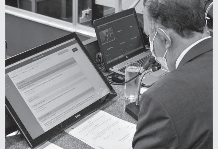
Deputados apreciam pareceres de projetos na Comissão de Agropecuária e Agroindústria

O projeto ainda fixa várias diretrizes para essa política de incentivo, entre as quais a