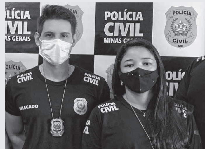
A Polícia Civil de Nanuque investigou o caso

2021, a vítima, à época com 12 anos, teria fugido de casa, aparentemente por influência de amigas, ocasião em que iniciou um relacionamento amoroso com o investigado de 20 anos. Em virtude do desaparecimento da menina, foi acionado o Conselho Tutelar. Após ser localizada, a jovem retornou para a cidade de Serra dos Aimorés, onde morava com a família. Ainda assim, a menina manteve o