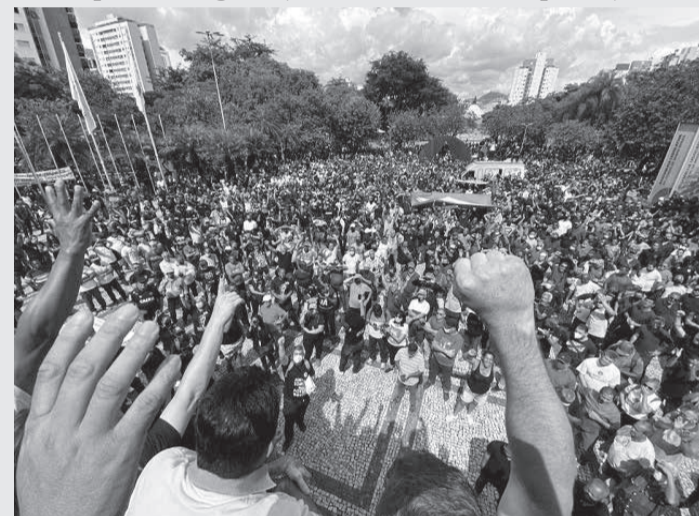
Servidores se reuniram na Praça da Assembleia

"Estamos juntos para buscarmos uma solução". O deputado lamentou a falta de diálogo do governo em relação ao Regime de Recuperação Fiscal, "preferindo judicializar a questão até chegar ao Supremo". O deputado Subtenente Gonzaga criticou Zema, que estaria chantageando a categoria para pressionar a Assembleia a votar o RRF. "Não vamos aceitar esse papel", avisou. Em sua opinião, o regime compromete a soberania do Estado e impõe prejuízos para a população e para os servidores públicos.