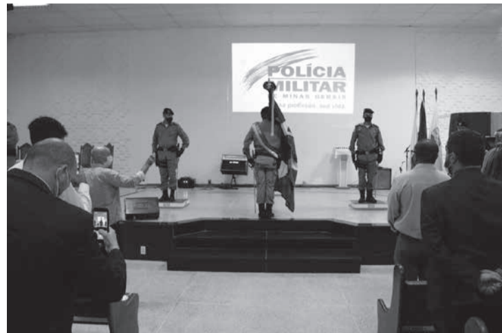
Solenidade de passagem de comando do 44º Batalhão de Polícia Militar

“A nossa missão constitucional nos conduz a algumas práticas, e ela é vivenciada nas unidades operacionais. Meu compromisso na academia de polícia me levou a tomar essa decisão, e hoje saio também de um batalhão operacional”. Disse que as promoções se deram todas exclusivamente pelo seu perfil, desempenho profissional de capacidade intelectual. Três pós-graduações, algumas oferecidas pela instituição que permitiu o seu crescimento interno, e outras nas faculdades parceiras e o seu esforço direto.