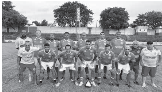
América de Teófilo Otoni