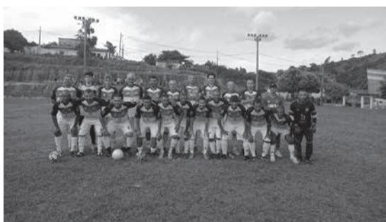
Rápido de Belo Oriente

Alguns jogos da terceira rodada da Copa União Masters dos Vales foram adiados, por conta das chuvas e da morte do ex-prefeito de Carai, Leopoldino José Ribeiro. Jogos adiados: Ataléia x Ouro Verde de Minas, Carai x Itaipé e Juventude x Setubinha. Do grupo A três jogos aconteceram: América 6 x 1 Frei Gaspar, Cristal 1 x 1 Teófilo Otoni, Nacional 2 x 0 Franciscópolis. Do grupo B, mais dois jogos foram realizados: Rápido 0 x 3 Machacalis, Crisólita 0 x 1 Corinthians. Em virtude do Carnaval, a quarta roda-