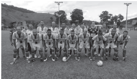
Esporte Clube Cristal