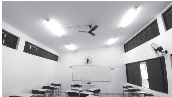
A companhia investiu, somente em 2021, R$ 11,7 milhões na troca da iluminação ineficiente de 1.124 escolas estaduais de todas as regiões de Minas Gerais, que ganharam lâmpadas especiais de LED, mais econômicas e confortáveis