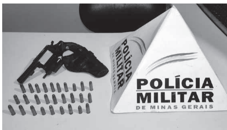
PM prendeu autor do crime e apreendeu a arma de fogo

na rua. Um vídeo divulgado nas redes sociais na manhã desta quarta-feira (02) mostra o momento que a vítima foi alvejada quando ainda estava dentro de um veículo, ele desceu e saiu correndo até cair, e o autor foi atrás e efetuou novos disparos.