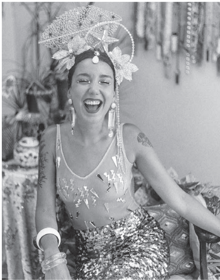
Lembranças carnavalescas: 2019

O grupo de confecções que participa da BH-a-Porter (entre 7 e 11