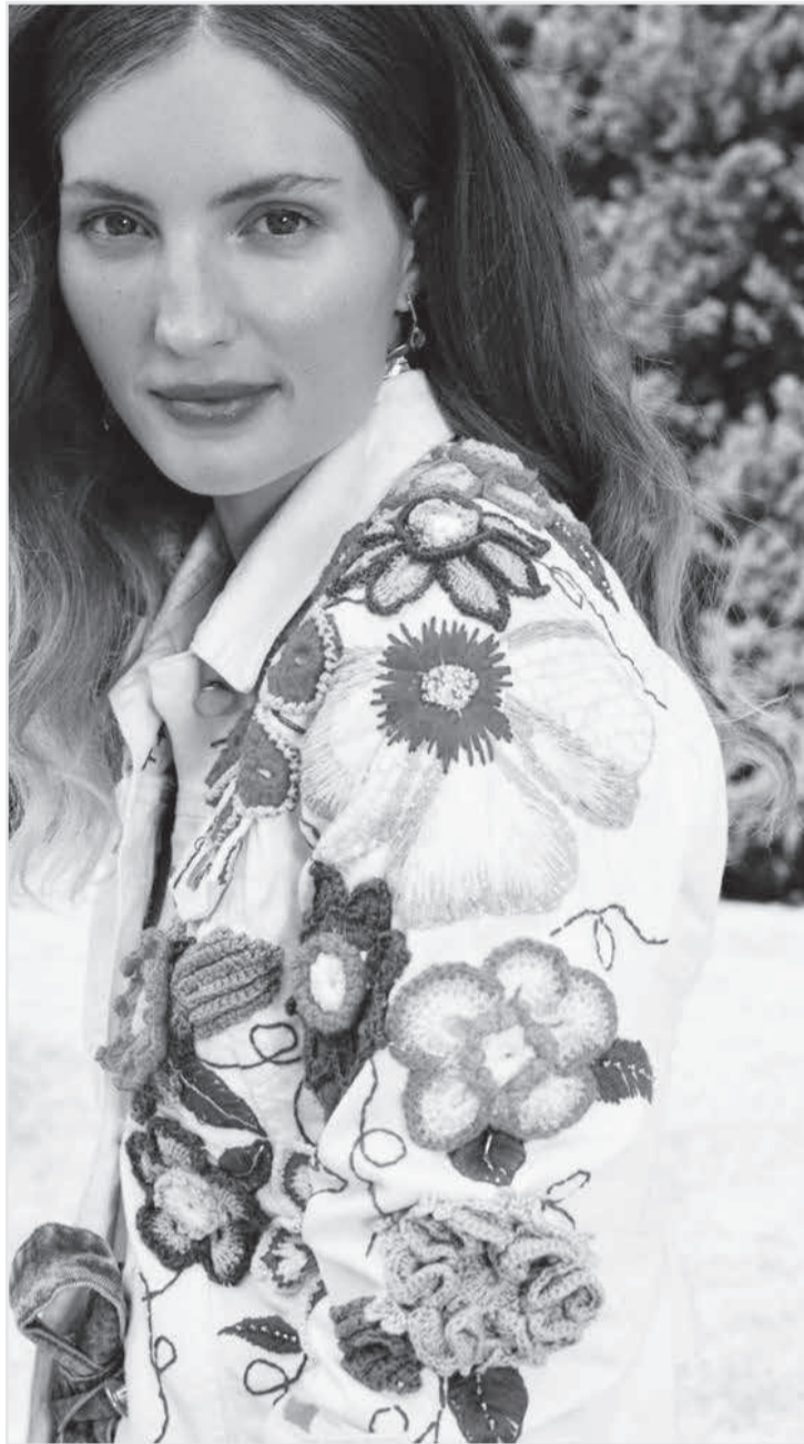
O inverno da Ametee