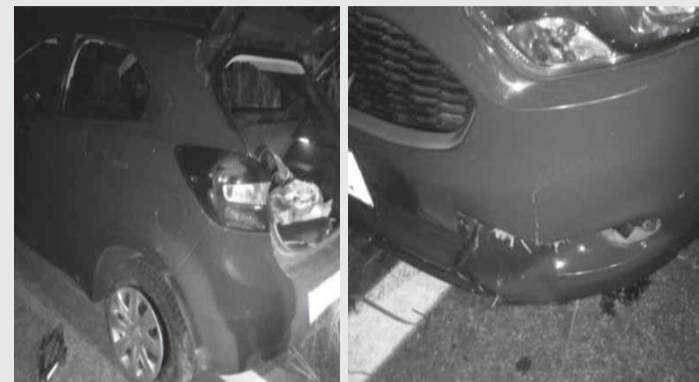
Acidente ocorrido na MG-105, município de Jequitinhonha

O segundo acidente ocorreu na MG-105, na cidade de Crisólita. O motorista foi encontrado dentro do carro, fora da pista, queixando-se de fortes dores, mas não se recordava do que havia acontecido. O motorista foi socorrido e encaminhado ao atendimento médico. O terceiro fato ocorreu na mesma MG-105, em Jequitinhonha. Na versão apresentada pela condutora, ela tentou ultrapassar um caminhão, perdeu o controle direcio-