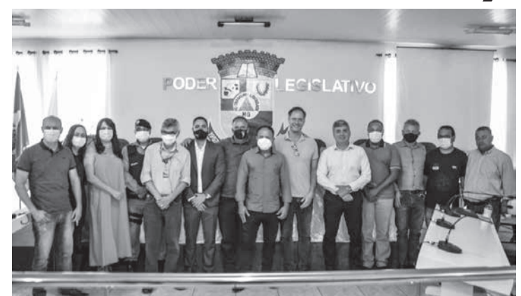
Representantes de diversos setores do Poder Judiciário, Executivo e Legislativo se reúnem em Divisópolis para os preparativos do Cejusc Itinerante

A equipe da Assessoria de Gestão da Inovação (Agin), vinculada à 3ª Vice-Presidência do TJMG, tem se reunido com autoridades do Executivo, do Legislativo, da Companhia Energética de Minas Gerais (Cemig), Empresa de Assistência Técnica e Extensão