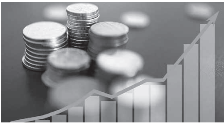
IPCA de fevereiro incorpora os reajustes habitualmente praticados no início do letivo

acumula alta de 10,54%. Em fevereiro, os principais impactos vieram da Educação (5,61%) e da Alimentação e Bebidas (1,28%). "Em fevereiro, são incorporados no IPCA os reajustes habitualmente praticados no início do ano letivo. Com isso, esse foi o grupo que teve o maior impacto no mês, contribuindo com 0,31 ponto percentual. O outro grupo que pesou bastante no mês foi o de alimentação