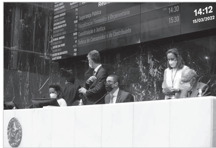
A mensagem do governador foi recebida na Reunião Ordinária desta terça-feira (15/03)

O percentual de revisão corresponde à inflação aferida pelo Índice Nacional de Preços ao Consumidor Amplo (IPCA) no ano de 2021. Também fazem jus à recomposição os aposentados e pensionistas com direito à paridade, além dos servidores em cargos comissionados, com funções gratificadas ou gratificações de função. O governador destaca na mensagem que a revisão proposta está de acordo com a Lei de Responsabilidade Fiscal, uma vez que a concessão de revisões