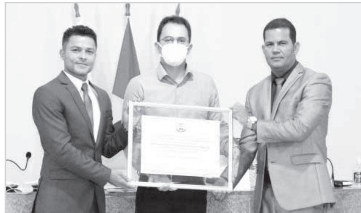
Homenagem do Legislativo em razão do trabalho realizado durante a pandemia

de 39 anos, são muitas as boas lembranças e exemplos que temos de servidores que construíram aqui uma história linda de dedicação e amor ao SUS", lembrou.