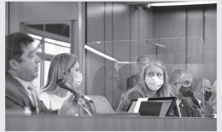
Na audiência, deputados se dividiram entre críticas e defesa do governador em relação à gestão da segurança pública no Estado

Enriquecimento ilícito - Muitos dos participantes falaram que, diante de tanta carência, é comum os servidores usarem equipamentos próprios, como celulares, para executar as tarefas e até se cotizaram para, por exemplo, fazer consertos ou adquirir mate-