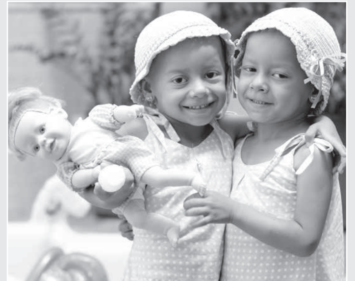
O Programa AI6%, da Cemig, apoia diversos projetos que beneficiam milhares de crianças e adolescentes em Minas Gerais

A analista da Cemig conta que, no ano passa-