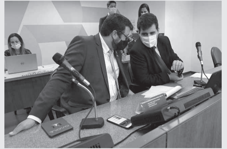
A tramitação de projeto do governador, agressão a jornalistas e greve da educação também foram lembrados nos debates