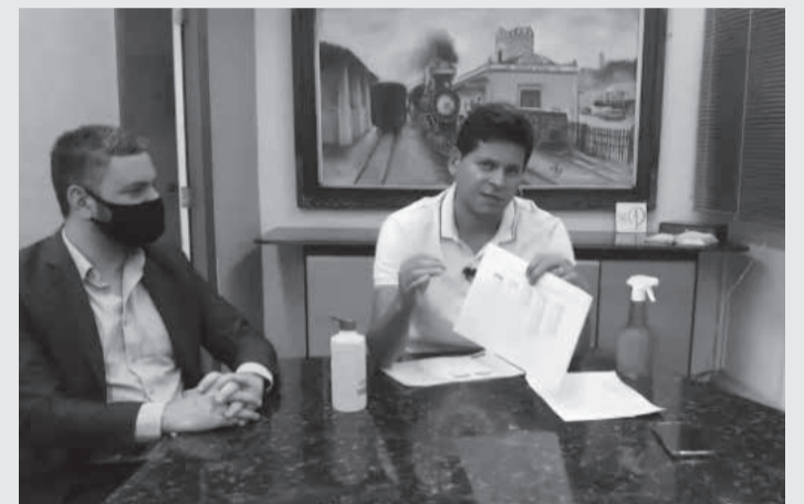
Segundo o prefeito, a Copasa está proibida de realizar obras não emergenciais até segunda ordem

não está cumprindo com aquilo que está no seu contrato com a Prefeitura Municipal de Teófilo Otoni. E, o nosso governo se esforçou muito para que a cidade recebesse as obras de extensão de rede de água e de esgoto, mas a gente sabe também que a população não pode viver prejudicada devido a esses péssimos trabalhos que estão sendo executados aqui no município”.