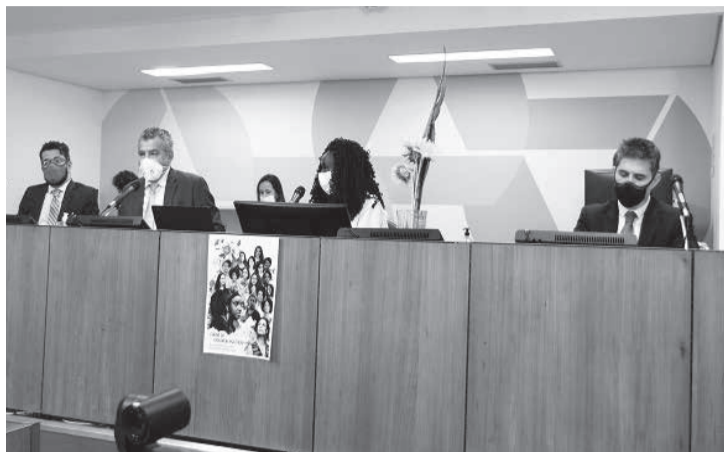
Participantes da audiência lamentaram a falta de respostas sobre o assassinato de Marielle Franco, em 2018

Quatro anos após a morte de Marielle Franco, mulheres negras com atuação política continuam sendo vítimas de ameaças