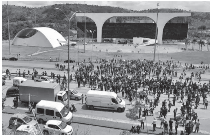
Forças de segurança pública de Minas protestaram em frente à Cidade Administrativa, sede do governo do estado

Servidores das forças de segurança de Minas Gerais realizaram na segunda-feira (21/03) um protesto para reivindicar recomposição salarial. Há um mês a categoria tem realizado atos na capital mineira, Belo Horizonte. A proposta com reajuste de 10,6% apresentada pelo governo mineiro foi rejeitada pelos integrantes das forças policiais.