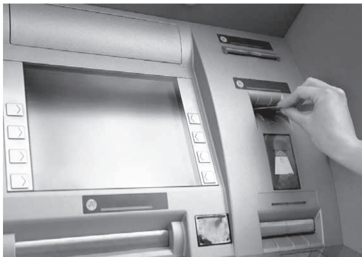
Cliente foi vítima de sequestro relâmpago e foi obrigada a fazer vários saques em instituição bancária, no Bairro Palmares, em Belo Horizonte (Crédito: Imagem ilustrativa)

Instituição deverá ressarcir valores sacados e pagar dano moral