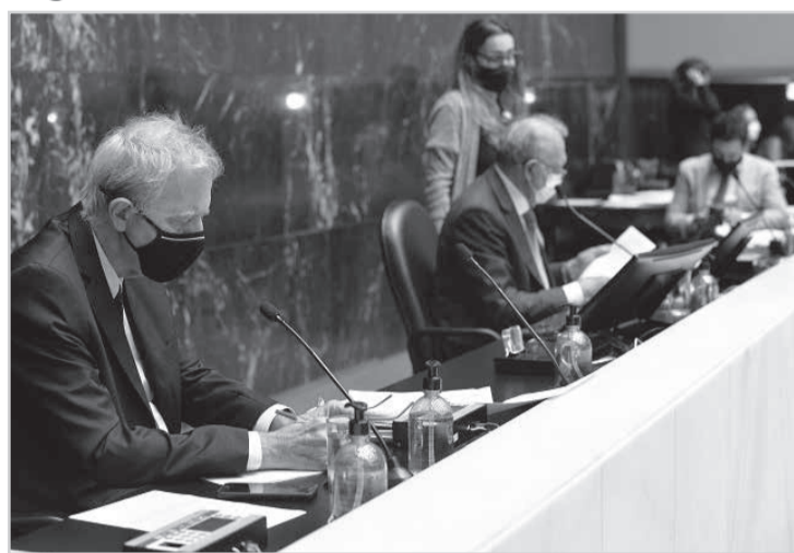
Governador também encaminhou emenda ao projeto de reajuste dos servidores e autorização de crédito suplementar para pagar essa despesa

Alguns deles, são sustentabilidade econômico-financeira, equidade intergeracional, transparência nas contas públicas, confiança nas demonstrações financeiras, celeridade nas decisões e solidariedade entre os Poderes e os órgãos da administração