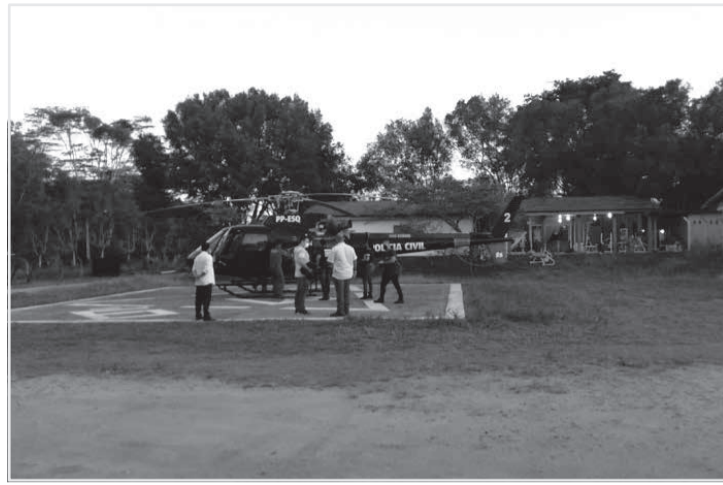
Foto do dia da Operação Katharizo (22/06/2021) realizada pela Polícia Civil em Águas Formosas que resultou na prisão do delegado

Segundo apurado, existem convênios entre a Polícia Civil e as prefeituras de Machacalis, Santa Helena de Minas e Umburatiba para fornecimento de combustível para abastecimento das viaturas da Delegacia de Águas Formosas. Sob o argumento de que essas cidades ficavam distantes, o denunciado, por pelo menos três anos, determinava que se buscasse a gasolina acondicionada em galões de 50 litros e guardava parte em casa (quatro galões) e parte na Delegacia (quatro galões). No entanto, dos galões guardados na residência, apenas um era utilizado no abastecimento das viaturas, sendo os ou-