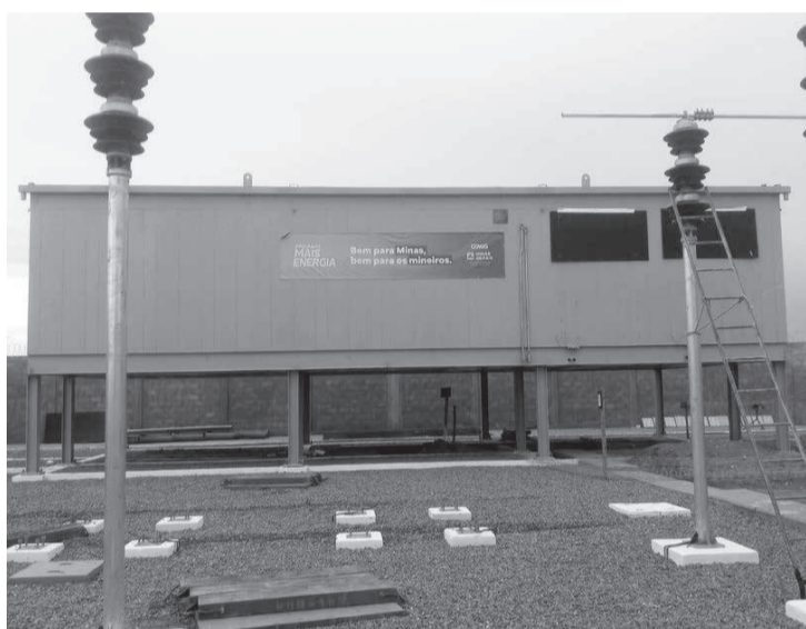
Subestação Minas Novas 2 faz parte de um investimento no sistema de distribuição de energia que a Cemig está fazendo para atender os cerca de 70 mil clientes