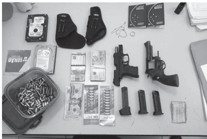
Materiais apreendidos pela Polícia Civil na Operação Katharizo deflagrada no dia 22/06/2021 em Águas Formosas

tros três utilizados em proveito próprio (peculato). A Justiça fixou regime inicial fechado para o cumprimento da pena de reclusão, sem direito de recorrer em liberdade. Nº: 0003050-38.2021.8.13.0009 (Ministério Público de Minas Gerais/ Assessoria de comunicação integrada).