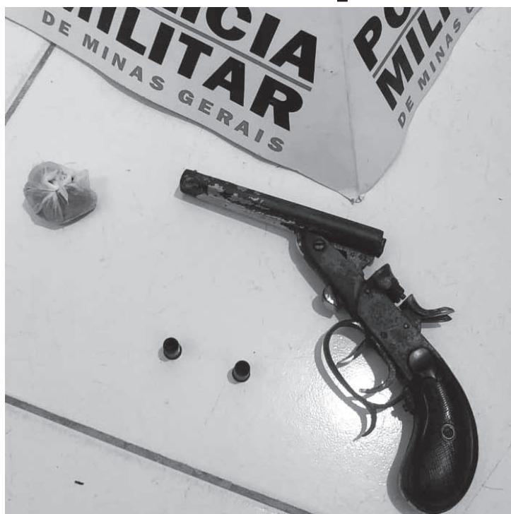
maconha. O material foi apreendido e encaminhado à delegacia de Polícia Civil para as medidas cabíveis. (Informações/Foto: Assessoria de comunicação organizacional da 24ª Cia PM Ind., Nanuque).

Os militares fizeram uma varredura no local e encontraram uma arma de fogo, tipo garrucha, 01 pedra de substância semelhante ao crack e 01 porção de substância semelhante à