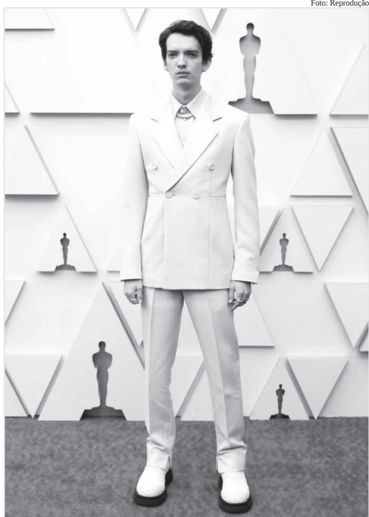
O ator Kodi Smit-McPhee e as jóias Cartier

• O circuito internacional da moda lamentou a morte do