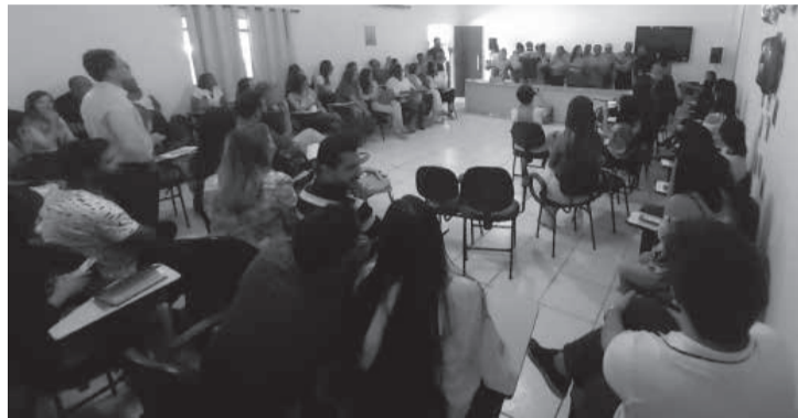
Colegiado de Saúde Mental contou com a participação dos 25 municípios