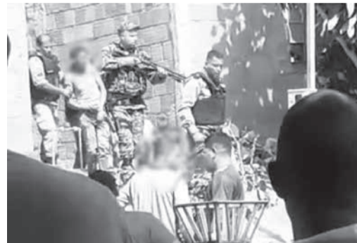
Na quinta-feira (12) o homem ateou fogo na própria casa, no Bairro São Jacinto, mas a polícia não conseguiu localizá-lo