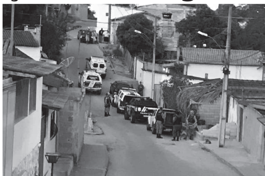
Operação conjunta realizada em Nanuque, na quinta-feira (12/05)

Na quinta-feira (12), equipes foram ao local onde Renato estaria escondido, cercaram o perímetro para evitar uma possível fuga, quando a equipe se aproximou, ouviu um barulho vindo da residência