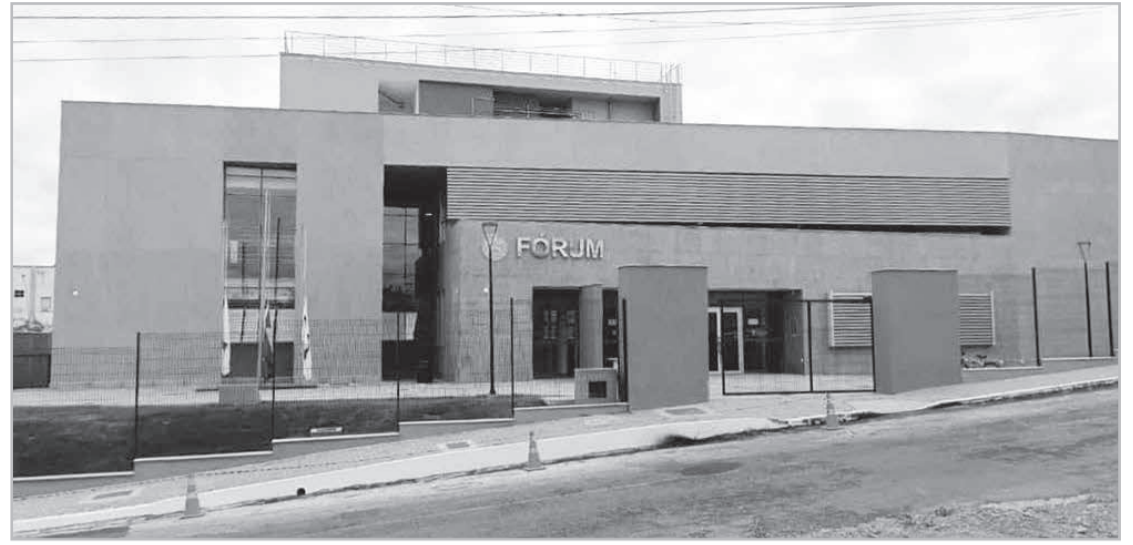
Novo fórum conta inclusive, com espaço para a instalação de uma terceira vara na comarca