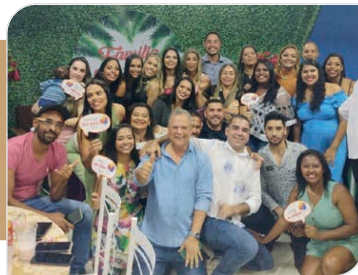
Diretoria, associados e funcionários do Hospital Apromia de Ataléia