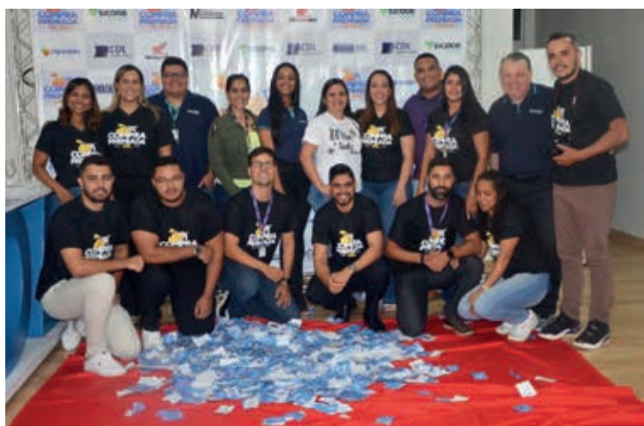
Equipe CDL-TO com patrocinadores da campanha Compra Premiada 2022

Compra Premiada CDL: Apresentação: Sicoob Credivale. Realização: CDL-TO. Patrocinadores: Motolider, Rede de Farmácias Indiana, Móveis Maanaim, Artes Gráficas Modelo e Sicoob AC-Credi. O próximo sorteio vai ser no dia 17 de junho, alusivo ao Dia dos Namorados, através de live nas redes sociais da CDL-TO. (Texto e fotos: Diário Tribuna).