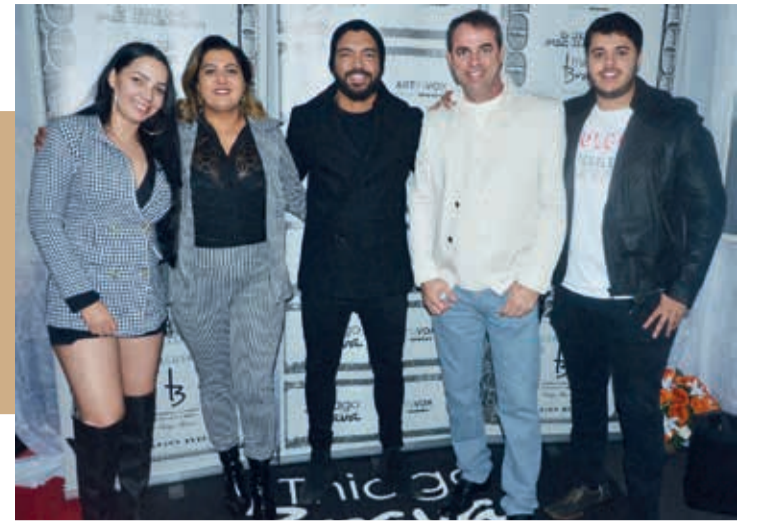
Reled Maikel e família com o cantor Thiago Brava, na sexta-feira (20)