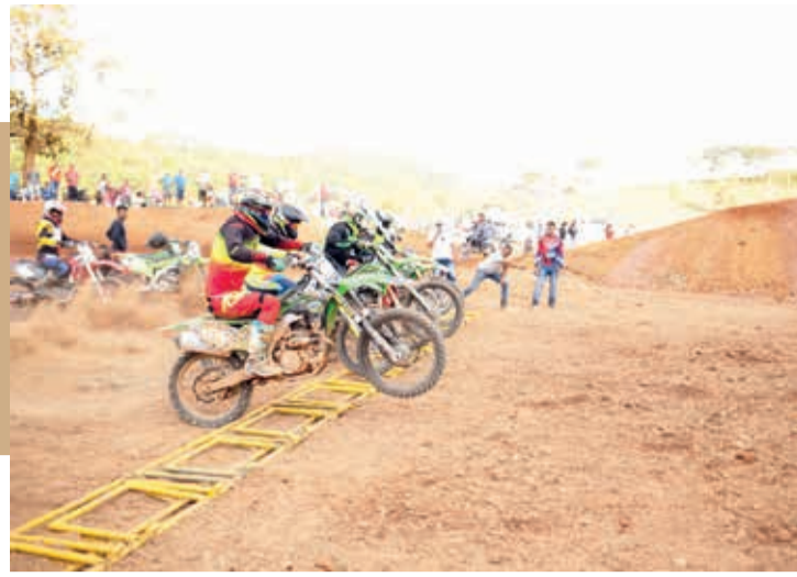
Motocross com muita adrenalina na tarde de domingo (22)