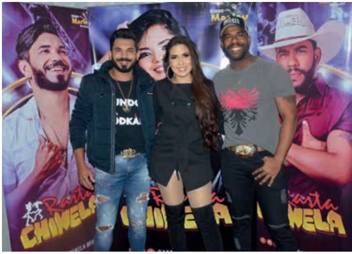
Banda Rasta Chinela animou o sábado em Concórdia do Mucuri