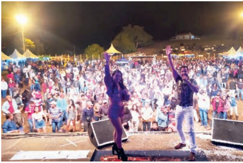
Show com a Banda Balançaê animou o sábado com muito forró