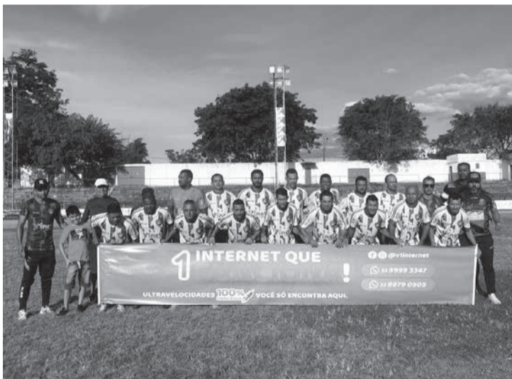
Clube de Machacalis