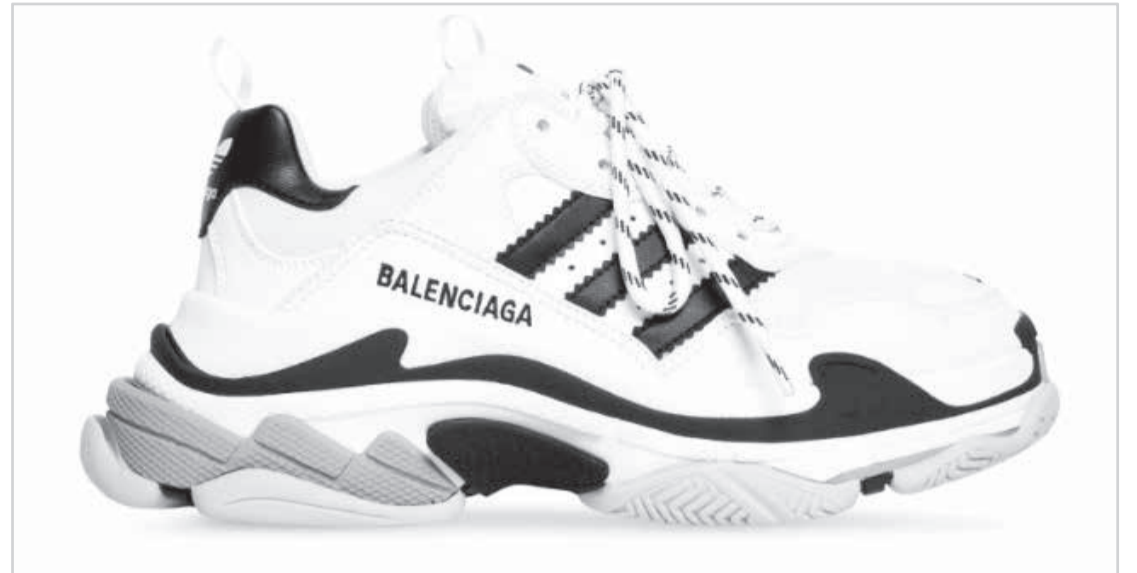
O tênis da Balenciaga + Adidas