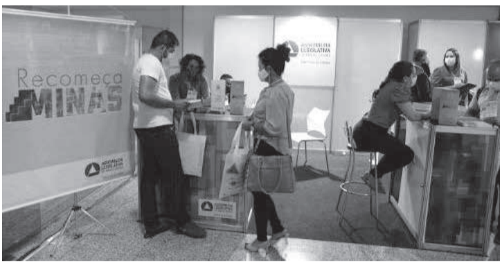
Em março deste ano, a ALMG participou do X Congresso Mineiro de Vereadores, também no Expominas

O estande irá destacar iniciativas do Parlamento mineiro, como o Recomeça Minas, que trouxe condições para que setores altamente atingidos pelos efeitos econômicos e sociais da pandemia de Covid-19 no Estado retomassem suas atividades. Outro destaque é o atendimento personalizado do Centro de Apoio