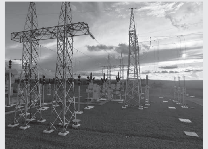
A nova subestação Minas Novas 2 vai entrar em operação nesta semana beneficiando 70 mil mineiros do Vale do Jequitinhonha