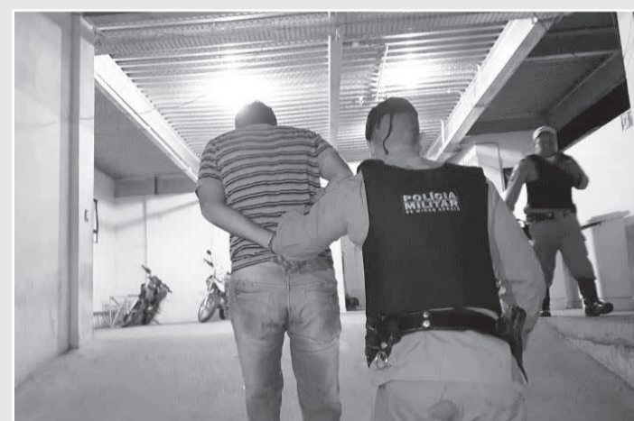
O pai da criança foi preso em flagrante pela Polícia Militar

ou se vai liberar com liberdade provisória.