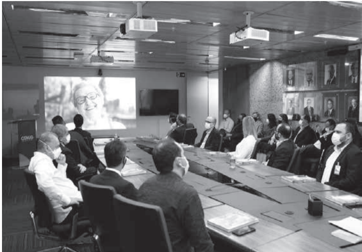
A solenidade de assinatura dos projetos aprovados, que aconteceu na sede de Cemig, contou com a presença de gestores da companhia e de representantes das instituições e empresas contempladas

Solenidade realizada na quinta-feira (09/06) marcou o início da realização dos projetos aprovados na Chamada Pública de 2021