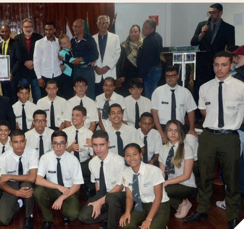
Adolescentes em Ação e vereadores de Teófilo Otoni