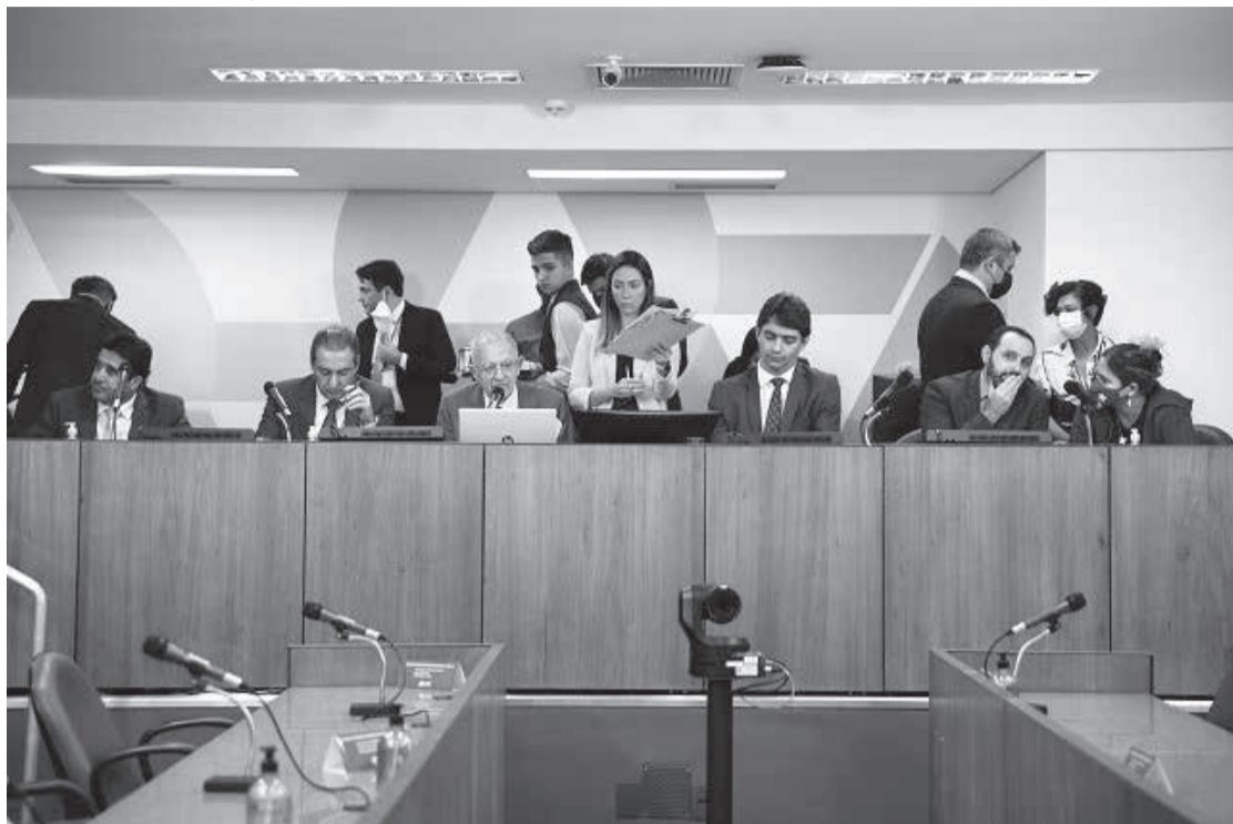
PL 3.723/22, do governador, recebeu parecer favorável da Comissão de Fiscalização Financeira e Orçamentária - Foto: Guilherme Dardanhan

Texto de autoria do governador, que tramita em turno único, prevê déficit orçamentário de R$ 11 bilhões em 2023