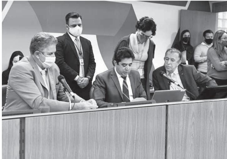
Os deputados presentes à reunião reforçaram os avanços trazidos pela PEC e garantiram que se empenharão em mais conquistas para a Polícia Penal de Minas

“A Emenda nº 1, em análise, vai ao encontro