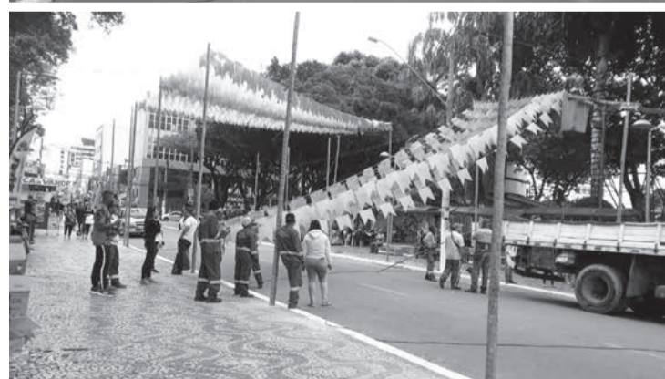
Preparativos para a realização do FESQUATO