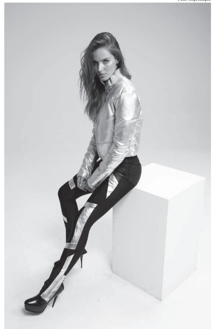
A moda da Charth