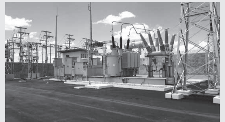
As novas subestações, como a SE Serra do Salitre, no Alto Paranaíba, vão reforçar o sistema elétrico do Estado e garantir mais disponibilidade de energia para a população mineira

Minas Gerais tenham cada vez mais energia em quantidade e qualidade que atendam o desenvolvimento econômico e social do estado. “Todas essas subestações vão beneficiar, diretamente, os municípios, a economia, a população das cidades e entorno, possibilitando a criação de emprego, geração de renda e oportunidades no estado. Com as novas subestações previstas no Programa, esperamos acabar com a demanda reprimida por energia no estado”, ressaltou.