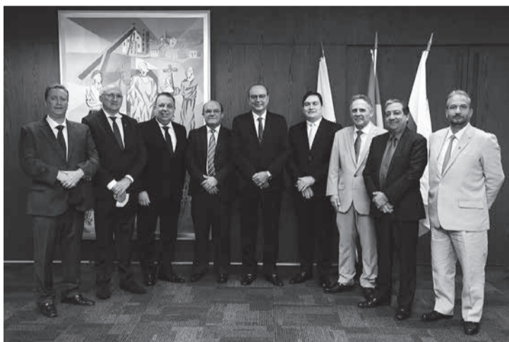
Os juízes convocados vão substituir os desembargadores eleitos para o biênio 2022-2024