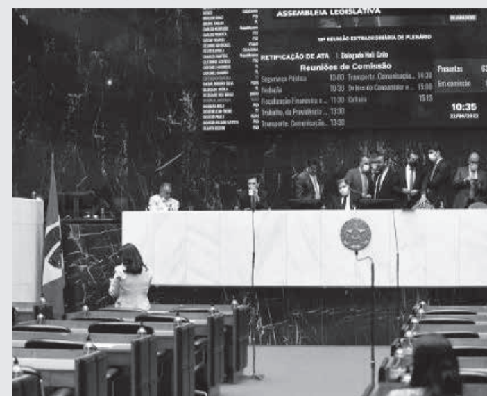
Matéria que trata dos cartórios foi aprovada pelos deputados em junho

O novo delegatário será investido perante o Corregedor-Geral de Justiça, no prazo de 30