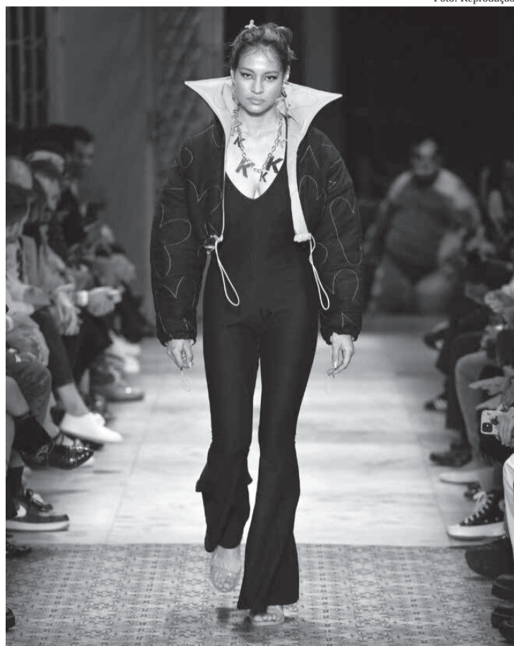
Desfile da Ken Ga na Casa de Criadores

• O quiproquó na moda internacional foi dada pela