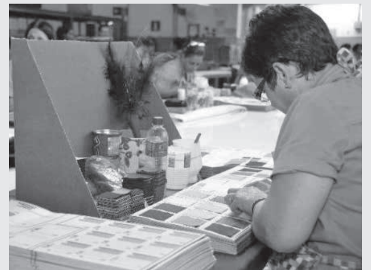
A qualificação profissional de mulheres vítimas de violência motivou lei aprovada

estadual de ensino para a promoção de atividades voltadas à prevenção e ao enfrentamento da violência contra a mulher. A matéria aguarda sanção do governador.