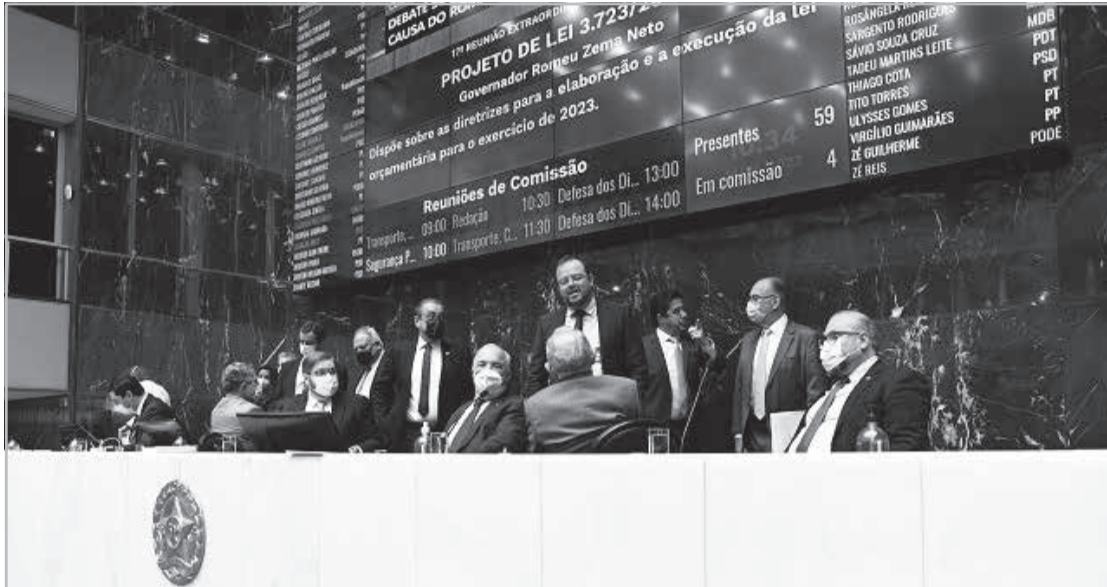
A LDO foi aprovada pelo Plenário em junho, com algumas emendas apresentadas por parlamentares, duas delas vetadas pelo governador

Matéria foi sancionada sem incisos sobre divulgação de imóveis e passivo de férias. Deficit para 2023 seria de R$11 bi