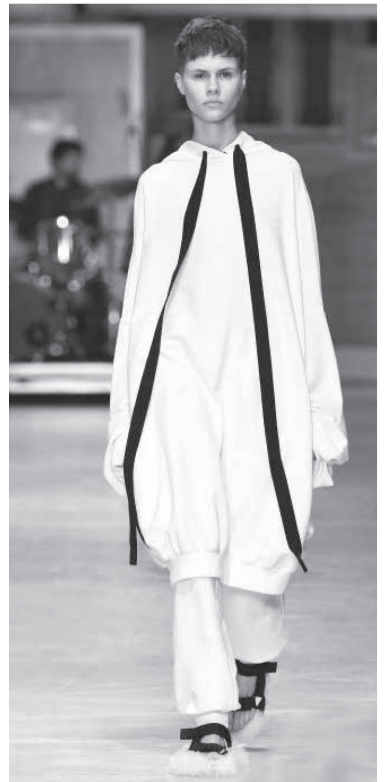
Desfile do Sou de Algodão