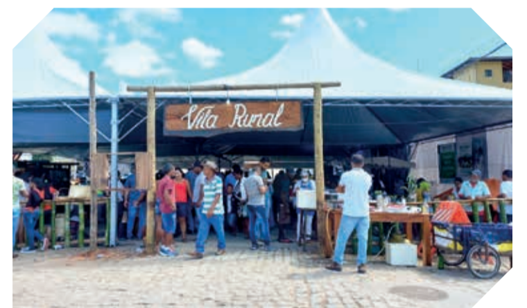
A Vila Rural foi bastante movimentada durante três dias