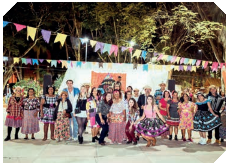
Na terça-feira (19) foi realizado o animado Arraiá Social