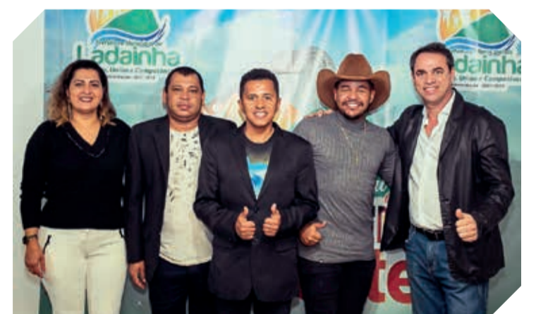
A Banda G2 foi uma das atrações musicais da noite de domingo (24)