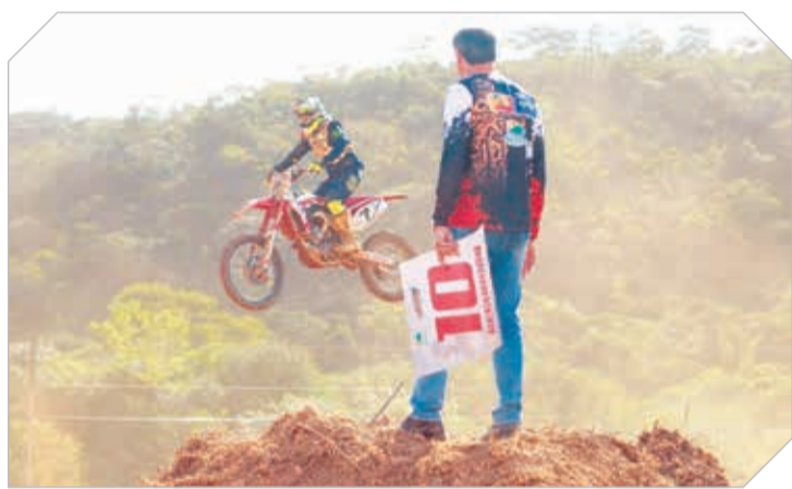
Motocross no domingo, um show de acrobacias e muita adrenalina