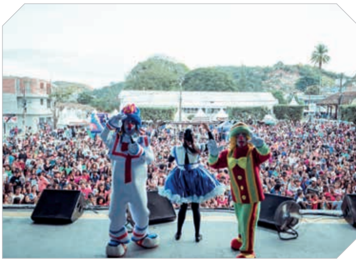
A criançada se divertiu com Shows Infantis na tarde de domingo (24)