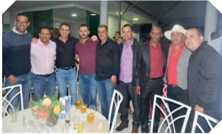
Assessor do Governador Zema e prefeitos prestigiaram o evento