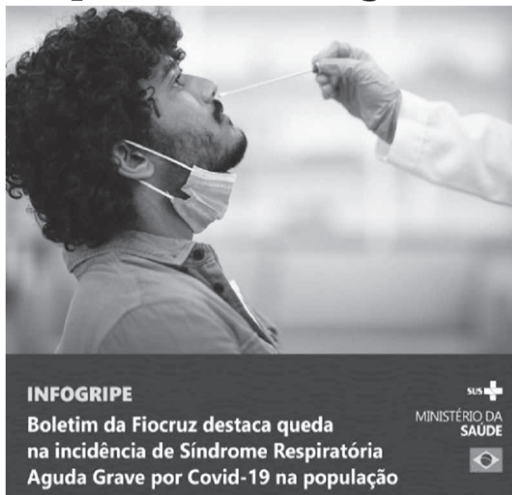
INFOGRIFE Boletim da Fiocruz destaca queda na incidência de Síndrome Respiratória Aguda Grave por Covid-19 na população

“A gente acredita que há esse efeito climático, porque o clima afeta o nosso comportamento, favorecendo a transmissão de vírus respiratórios. O inverno também contribui. Agora, o quanto é do inverno e o quanto é das novas variantes a gente não consegue separar ainda”, disse o pesquisador. Ainda segundo a publicação, vários estados estão em situação de platô