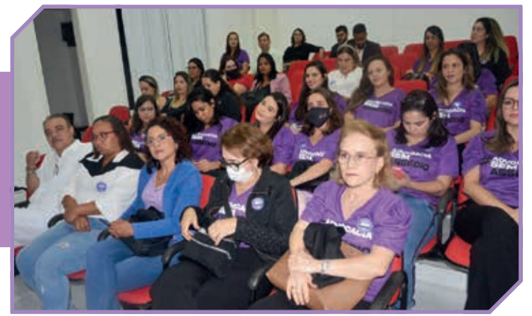
Lançamento em Teófilo Otoni da campanha de combate ao assédio sexual e moral na advocacia