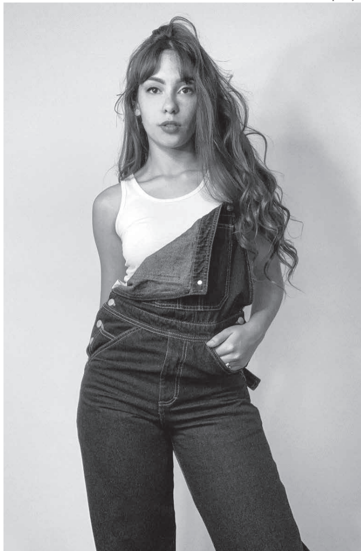
O jeans Marcel Philippe

Os espanhóis fizeram uma campanha de verão para valorizar o corpo feminino em suas várias formas, mas o tiro saiu pela culatra. As modelos usadas nos cartazes, não deram autorização para isso