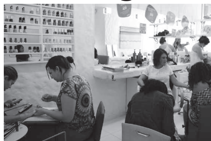
Setor de transportes teve alta de 0,6% e foi o que mais influenciou o resultado dos serviços em no mês de junho

Das cinco atividades investigadas, quatro registraram crescimento. Luiz Almeida, analista da pesquisa, destaca que o setor de transportes, com alta de 0,6%, foi o que mais influenciou o resultado em junho. “Neste mês, a maior influência positiva veio do setor de transportes, com destaque para