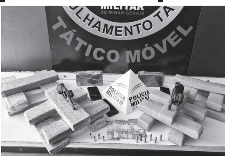
telefones celulares e R$ 449,00. O casal foi encaminhado para a delegacia de Polícia Civil com os materiais apreendidos.

Material apreendido: 01 revólver Taurus oxidado calibre 38, 01 revólver INA oxidado calibre 32, 04 munições calibre 32, 06 munições calibre 38, 20 barras de substância semelhante à maconha, 02 barras de substância semelhante ao crack, 03