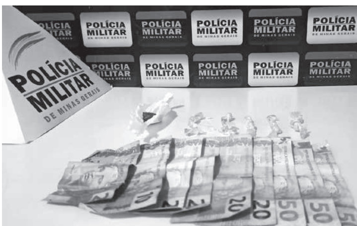
Noelisson. (Informações/nicação organizacional do).

A mulher de 55 anos e o homem de 30 anos foram presos por tráfico de drogas, o outro por uso e consumo. Foram apreendidas 24 pedras de crack, 01 bucha de maconha e R$ 242,00 em espécie. Equipe Mata Verde: sargentos Wilke e Tiago, cabo Paiva, soldados Pedroso e