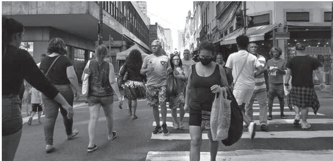
Desemprego tem queda em 22 estados no 2º trimestre de 2022

A taxa de desocupação apresentou queda em 22 unidades da federação no 2º trimestre de 2022, frente ao tri anterior, refletindo a redução, disseminada nos estados, do índice nacional de 11,1% para 9,3% no período. Outros cinco estados registraram estabilidade. Os dados são da Pesquisa Nacional por Amostra de Domicílios Contínua (PNAD Contínua) Trimestral, divulgada hoje (12) pelo IBGE. Já no confronto anual, contra o 2º trimestre de 2021, todas as 27 UFs tiveram queda significativa da taxa de desocupação. O estado do Tocantins registrou o maior recuo do 1º para o 2º tri: menos 3,8 pontos percentuais (p.p.), seguido por Pernambuco (3,5 p.p.) Alagoas, Pará, Piauí e Acre também se destacaram, com quedas de cerca de 3 p.p. nos quatro estados.