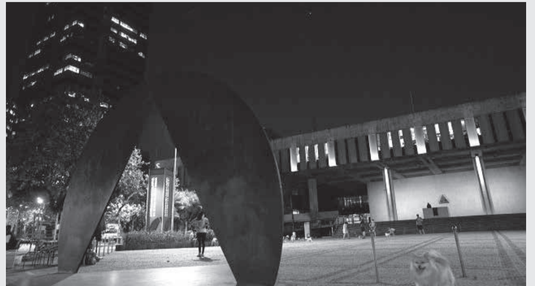
No dia 2 de outubro os eleitores mineiros vão escolher os 77 ocupantes das cadeiras de deputado estadual na Assembleia de Minas

Dos atuais deputados estaduais que atuam na Assembleia Legislativa de Minas Gerais (ALMG), 66 vão tentar a reeleição, quatro vão se candidatar a deputado federal, um a vice-governador, um a senador, um a suplente de senador e quatro não concorrerão a nenhuma vaga nas eleições de 2022.