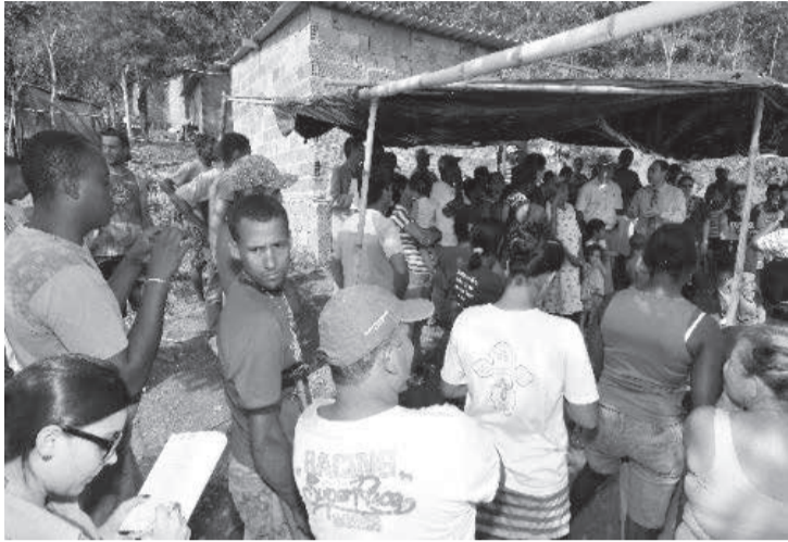
Despejos, como esse no Conjunto Zilá Sposito, se repetem quando a Cohab atua timidamente na redução do déficit habitacional