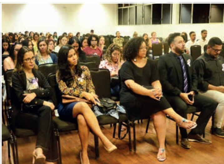
A Audiência debateu sobre a violência doméstica e familiar contra a mulher

muitas pessoas ficaram mais tempo dentro de casa. “Eu costumo falar que esses agressores, eles não estão agredindo mais, eles estão matando as mulheres. A tolerância está cada vez menor, e nós mulheres estamos morrendo. E eu vejo que se torna sempre uma estatística. Vemos na televisão, as pessoas se comovem com aquele fato, e depois vem outro, e isso vai passando. E o que nós fazemos para isso mudar, a nível municipal, estadual e federal? Precisamos realmente de políticas públicas efetivas”, disse. Nas próximas edições traremos a participação de outras pessoas que participaram da audiência e compuseram a mesa. ■