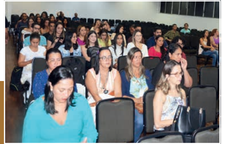
Também participaram do evento alunos de Direito, Psicologia e Enfermagem