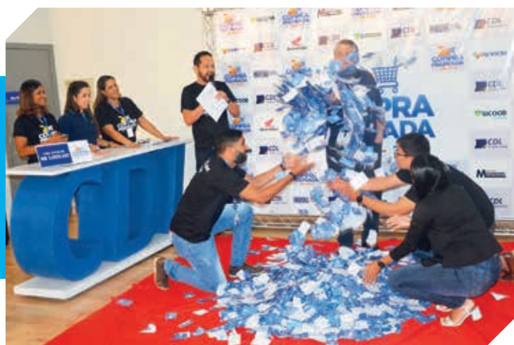
Sorteio realizado no auditório da CDL, transmitido ao vivo, na sexta-feira (19/08)