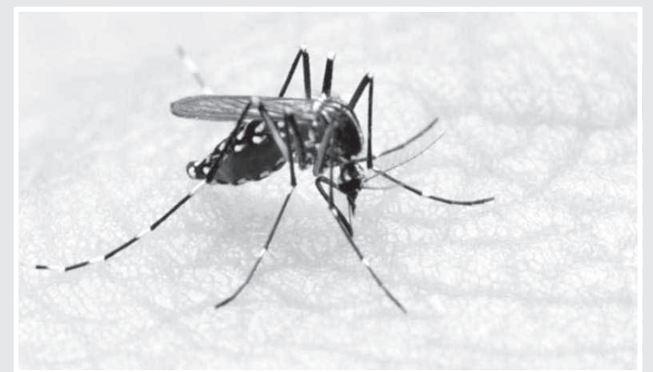
Fonte: SIMAN - Dados parciais, sujeitos a alteração. Atualizado sexta-feira, 16 de agosto de 2022

Normalmente, a primeira manifestação da dengue é a febre alta (39º a 40ºC), de início abrupto, que geralmente dura de 2 a 7 dias, acompanhada de dor de cabeça, dores no corpo e articulações, prostração, fraqueza, dor atrás dos olhos, erupção e coceira na pele.