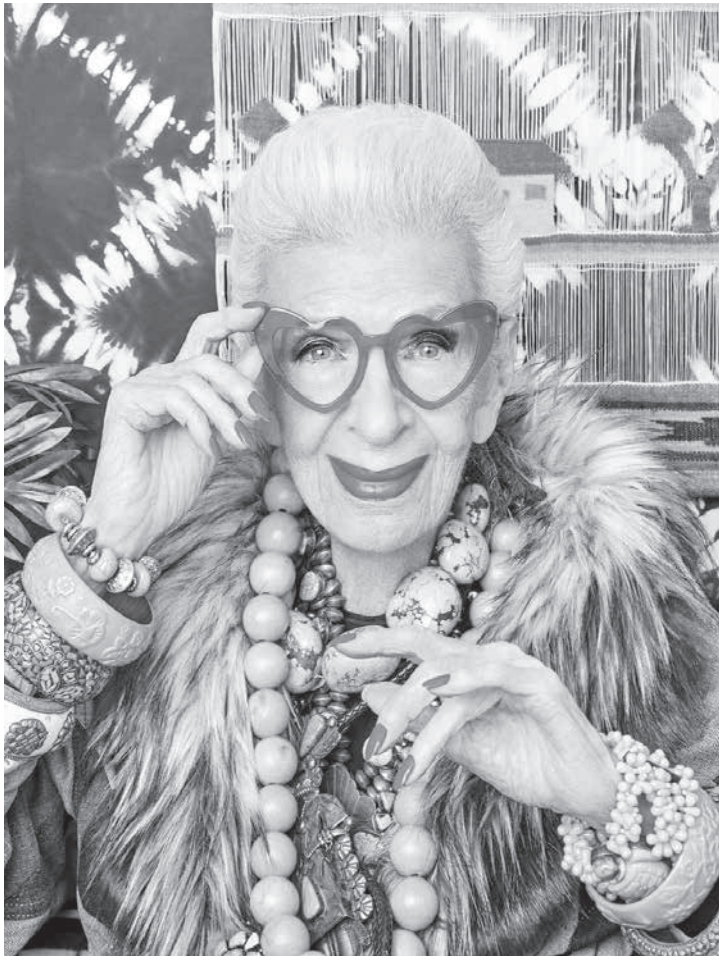
Iris Apfel, ícone do ageless fashion

• Movimentando cerca de 3 bilhões de reais no ano em nosso país, o comércio de roupas usadas é um dos que mais crescem no segmento fashion. O destaque fica por conta das roupas de marcas de luxo internacionais – revendidas a preços acessíveis. Para evitar fraudes, um robô foi criado para escanear essas roupas e garantir se são autênticas. Um achado. Mas as donas desse negócio continuam apostando, também, no seu próprio