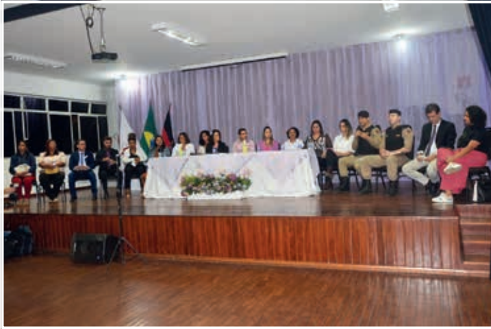
Composição da Mesa Diretora na Audiência Pública sobre Violência Doméstica