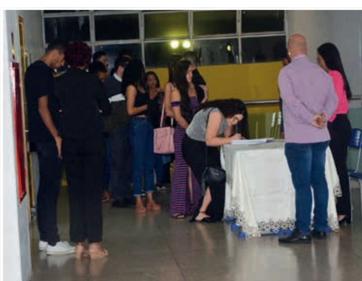
O evento foi bastante participativo com presença de universitários da cidade