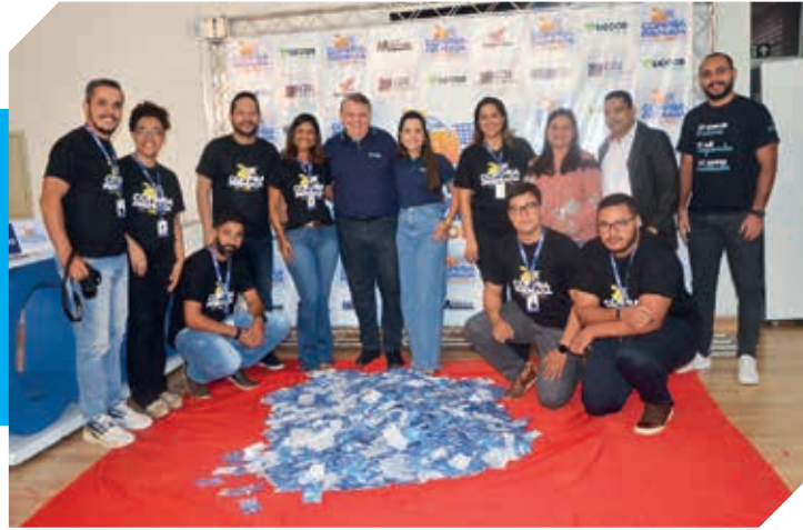
Equipe CDL-TO com patrocinadores da campanha Compra Premiada 2022