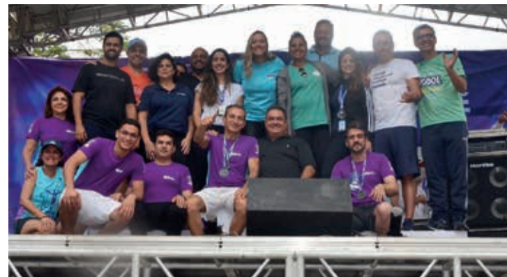
Diretores da Indiana com os parceiros, fornecedores