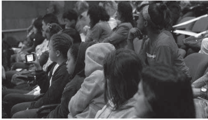
Todos os menores de 18 anos estarão dispensados da coleta e registro de seus dados para entrada na Casa

sas adequações também terão impacto no controle de acesso de crianças e adolescentes às dependências da Assembleia. Pelos novos procedimentos, todos os menores de 18 anos estarão dispensados da coleta e registro de seus dados no processo de credenciamento para entrada na Casa.