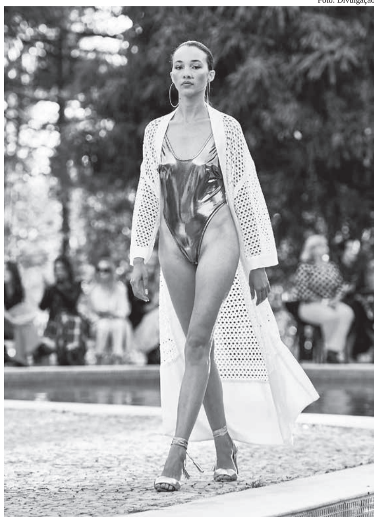
O verão da Alphorria

• O movimento do verão começou na moda mineira, incluindo o varejo. Um dos eventos mais