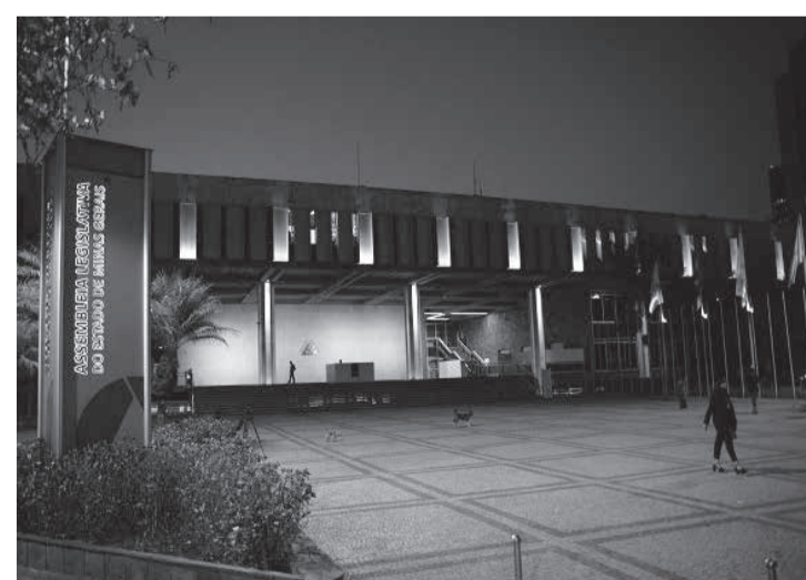
Sede do Legislativo receberá iluminação especial entre 1º e 16 de setembro

apoia o movimento Setembro Amarelo, liderado por instituições como as Associações Mineira e Brasileira de Psiquiatria, Conselho Federal de Medicina (CFM), Centro de Valorização da Vida (CVV), entre outras. Mundialmente, a Associação Internacional para Prevenção do Suicídio estimula a divulgação da causa. O Legislativo também tem iniciativas como a Semana Estadual de Valorização da Vida, instituída pela Lei 22.836, de 2018, e a política estadual de valorização da vida na rede estadual de ensino, tratada na Lei 23.764, de 2021. A prevenção do suicídio e a promoção da saúde mental também são temas das Leis 24.134 e