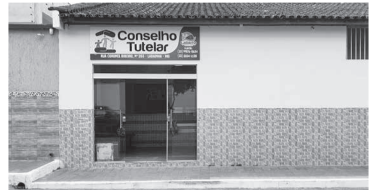
As Conselheiras tutelares da cidade solicitaram que a PM registrasse a ocorrência

bebidas servidas aos alunos e servidores e encaminhassem imediatamente à delegacia de polícia, local onde, extraordinariamente, uma servidora os aguardava para receber o material, assim foi feito.