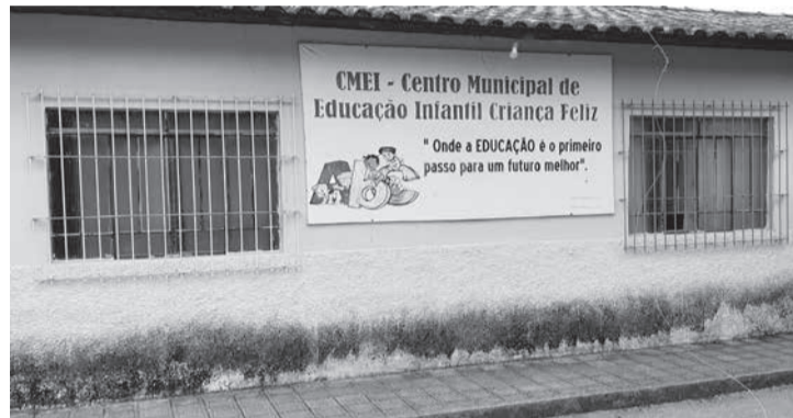
O almoço foi servido no Centro Municipal de Educação Infantil Criança Feliz (Cmei)