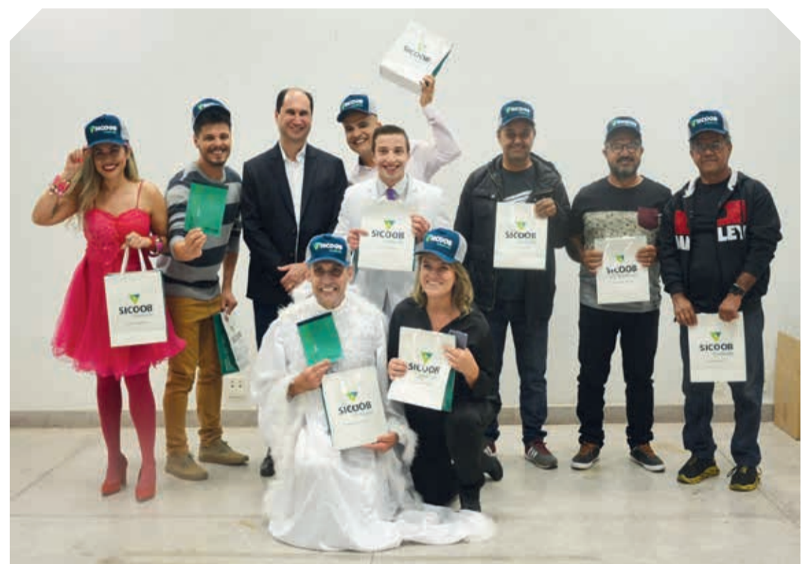
Elenco da peça teatral foi apresentado com Kits do Sicoob Credivale - Teófilo Otoni