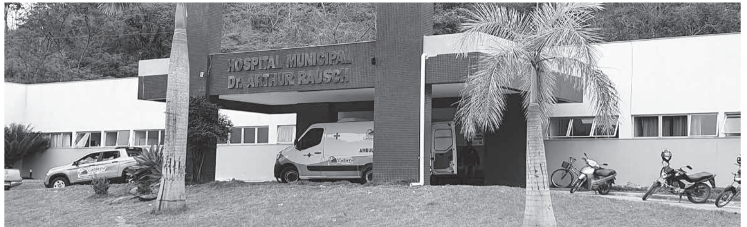
Todos que tiveram a intoxicação receberam atendimento imediato no hospital da cidade

Uma mulher que trabalha no CMEI disse que foi ajudar as suas colegas a arrumarem o local que havia recebido os alunos, que todos já haviam almoçado, e ela decidiu comer um pouco da mesma refeição, e quando comeu o arroz com frango notou que estava com um forte cheiro de "perdido", tendo descartado no lixo. A perícia técnica da Polícia Civil não foi ao local, mas o delegado da cidade orientou que fizessem a coleta de amostras dos alimentos e