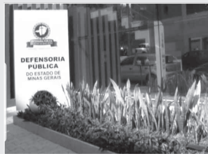
Inscrições podem ser feitas na Defensoria Pública em Teófilo Otoni, no Bairro Marajoara

O drama de não conhecer e não ser reconhecido pelo pai, que implica quase sempre em não receber nenhum tipo de assistência finan-