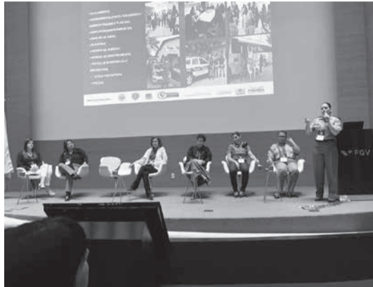
Atividade do evento