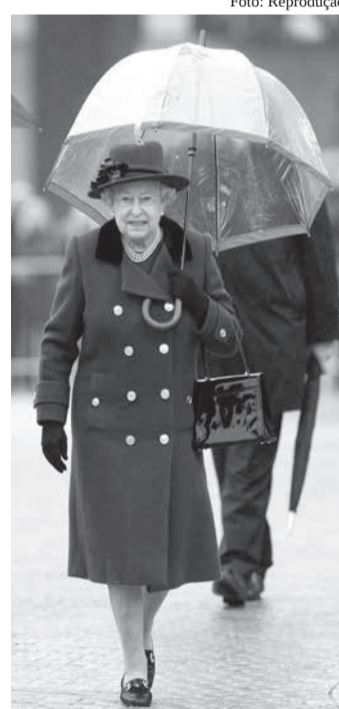
Rainha Elizabeth II e seu estilo marcante

• PONTO FINAL: a Minas Trend está preparando eventos diferenciados para a sua edição de novembro (entre 2 e 4