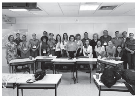
Participantes da Mesa de Debates após palestras