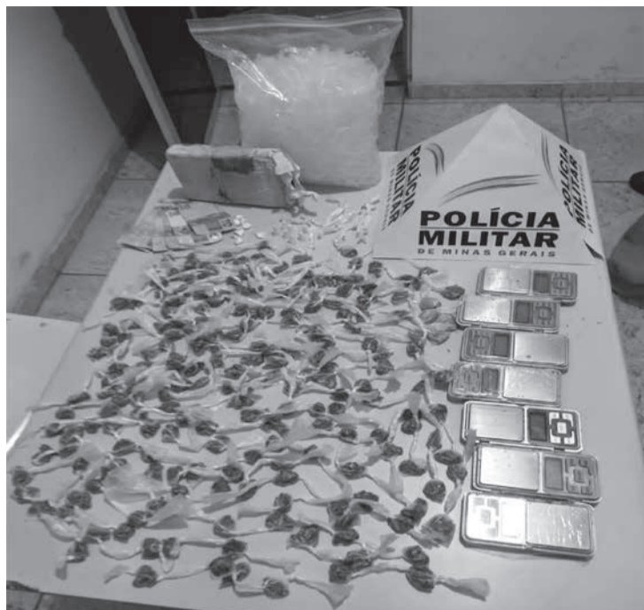
víduos não foram capturados. Equipes policiais: POP Norte, tenente Arnaldo, sargentos Bernardo e Everton. (Informações/Foto: 19º BPM).

Na fuga eles deixaram para trás, 216 buchas mais 01 tablete grande de maconha, 14 pinos com cocaína, 20 pedras de crack, R$ 110 em dinheiro e 7 balanças de precisão. Foi feita uma perseguição, mas os indi-