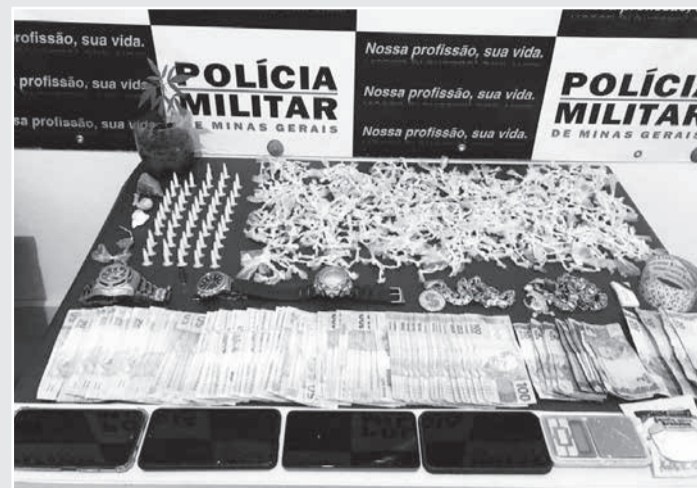
Materiais apreendidos: 1.046 pedras de crack, 01 pedra bruta mais 01 porção crack, 52 pinos mais 01 papelote com cocaína, 02 buchas de maconha, 03 vasos de plantas de maconha, R$ 5.415,00 em espécie, 01 apontador laser de arma de fogo, 01 estojo deflagrado de muni-

Na tarde de terça-feira (13/09), a Polícia Militar recebeu denúncias informando que em uma casa situada no Bairro Isadélia Ferraz de Brito, na cidade de Nanuque, estaria sendo utilizada para tráfico ilícito de entorpecentes, e a equipe do GEPAR (Grupo Especializado de Policiamento em Área de Risco) foi imediatamente ao local e cercou a casa. Durante a operação, os militares visualizaram um vaso plástico contendo plantas semelhantes às de maconha. Diante da situação de flagrante, a equipe entrou no local, onde foram encontrados drogas, dinheiro e joias/semijoias.