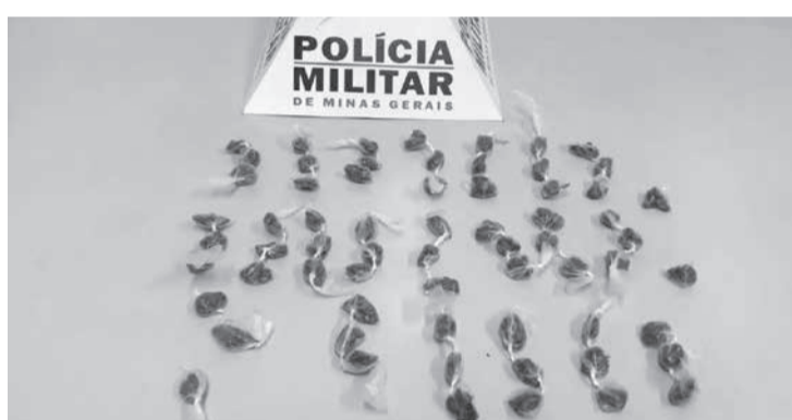
não foram alcançados. Durante buscas pelo local que acessaram foi localizado o entorpecente, que foi encaminhado para a delegacia de Polícia Civil para as medidas de polícia judiciária. (Informações/Foto: 19º BPM).

Durante a incursão na Rua Mucuri, vários indivíduos ao perceberem a presença policial fugiram acessando um matagal, e