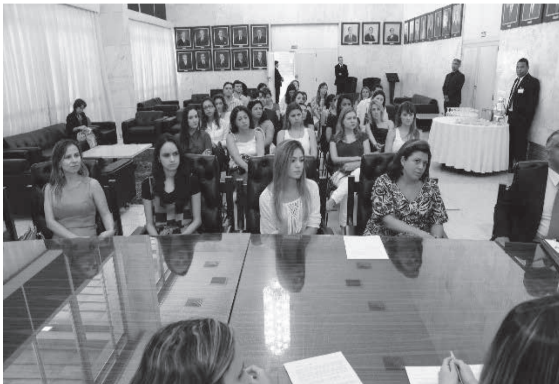
Aprovados no último concurso em reunião com o presidente da Assembleia

São 200 vagas para os níveis médio e superior; pedidos de isenção da taxa de inscrição podem ser feitos até sexta-feira (16)